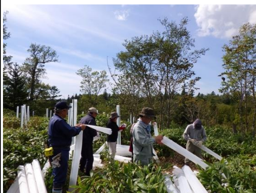
▽令和7年度活動風景(保護管組立)

令和8年度に雷別国有林(標茶町雷別)で、「広葉樹の森林づくり」活動等に参加していただけるボランティアの方々を募集します。 シラルトロ湖に注ぐシラルトロエトロ川の最上流部に位置する雷別国有林には、林齢が70年を超える森林が広がっています。平成12年にその一部のトドマツ人工林が、立ったまま枯れてしまう被害に遭い、笹地となってしまう箇所があります。当センターでは、この被害箇所を郷土樹種である多様な広葉樹(ミズナラ、ヤチダモ、キハダ、カツラ等)を計画的に植栽する等、森林再生に取り組んでいます。