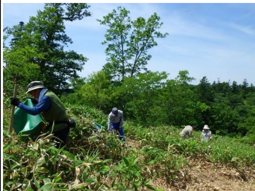
▽令和7年度活動風景(広葉樹植樹)

令和8年度に雷別国有林(標茶町雷別)で、「広葉樹の森林づくり」活動等に参加していただけるボランティアの方々を募集します。 シラルトロ湖に注ぐシラルトロエトロ川の最上流部に位置する雷別国有林には、林齢が70年を超える森林が広がっています。平成12年にその一部のトドマツ人工林が、立ったまま枯れてしまう被害に遭い、笹地となってしまう箇所があります。当センターでは、この被害箇所を郷土樹種である多様な広葉樹(ミズナラ、ヤチダモ、キハダ、カツラ等)を計画的に植栽する等、森林再生に取り組んでいます。