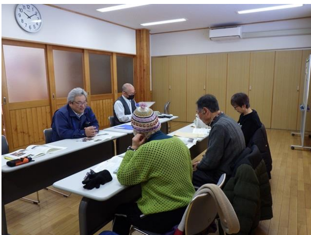
▽第4回雷別ドングリ倶楽部の様子

令和8年2月4日、第4回雷別ドングリ倶楽部を開催しました。 今回は、3名の参加があり、先ず始めに、参加者の自己紹介を行い、その後、令和7年度の活動の振り返りを行うとともに、令和8年度の活動計画（案）を説明しました。 また、来年度の自然観察箇所は、「和琴半島」に決まりました。 会員の方々と、植栽本数や今後のドングリ倶楽部について、意見交換を行いました。これらを通じて、「雷別ドングリ倶楽部」の活動をより良くしていきたいと考えています。