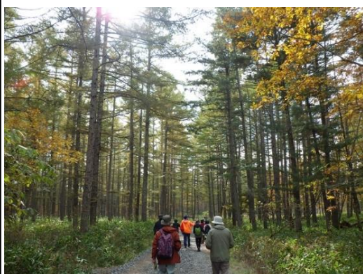
▽令和7年度活動風景(自然観察)

今回、会員を募る「雷別ドングリ倶楽部」は、平成19年7月から活動しており、雷別国有林の「森林づくり」活動等に、継続的に関わっていただいているボランティアの方々の集まりです。 募集内容等 ♪募集人数 先着順で20名 ♪募集期間 4月1日(水)から4月17日(金)まで *募集人数に達し次第、締切りとします。 ♪氏名・年齢・住所・電話番号を明記のうえ、当センターまでメール、電話等でご応募下さい。 ♪各自で、社会福祉協議会「ボランティア活動保険」等のご加入を必ずお願いします。