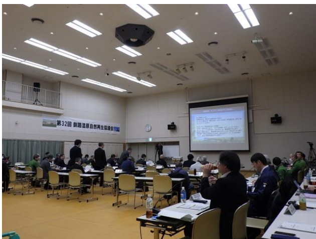
▽協議会開催の様子

令和8年3月4日、釧路市生涯学習センターで開催されました。 まず、全体構想の見直しに関する検討状況、骨子案を提示し、全体で討議しました。次回の協議会にて改定の承認をいただく予定です。 次に、各事業報告を行いました。今回の協議会では、報告内容を事前配信しました。当センターの雷別地区自然再生事業については、今年度の植栽状況、昨年度保護管を撤去した箇所の実況等を報告しました。 協議会を通して、現状を確認できる機会になったと思います。