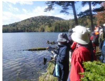
▽オンネトーの景観

会で植樹と併せ根釧地域の森林の名所を巡る活動計画があり、コロナ禍もありましたが行動制限も発出されていなかったことから予定通り行うことが出来ました。当日は、会員20名が参加し、秋晴れの空のもと、センター職員の若干の解説を交え散策しました。