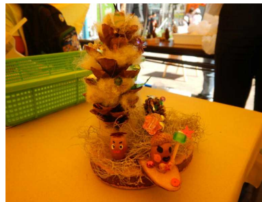
▽子どもたちの完成した力作

子どもたちの思い思作ってもらったところ、端材を沢山使った大きな作品や木の輪切りにかわいらしい顔を描いた作品等、子どもたちの笑顔がいっぱいになる個性的な作品が沢山ありました。 当日は、この時期としては日差しが強く真夏を感じさせる天気でしたが、親子で木工クラフトに取り組む姿や友だちと一緒に作る様子が見られる等、大盛況となり、皆さんの笑顔が印象に残る一日となりました。