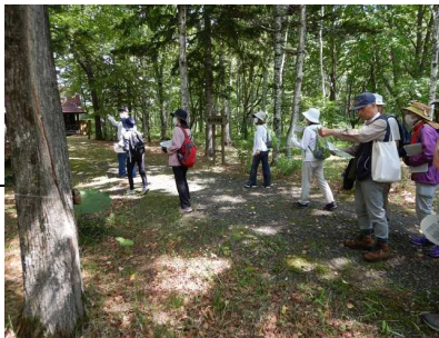
▽樹木見本園内散策の様子