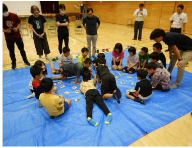
▽「北の森カルタ」実施の様子

作成した、楽しく森林のことが学べる「北の森カルタ」を小学校低学年と高学年・中学生の2班に分かれ行いました。（児童生徒27名） 思っていた以上に白熱したものであり、かなり会場は盛り上がりました。札の読み上げは、職場体験の研修生2名（北海道教育大岩見沢校生と岩手大学大学院生）にしていたいただきました。児童生徒からは、「面白かった。楽しい。」「またしてみたい。」などの感想がありました。研修生も「貴重な経験をさせてもらって良かった。」と言っていました。