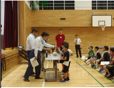
▽水質浄化装置の実演の様子