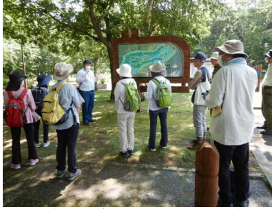
▽正美公園成り立ちの説明の様子