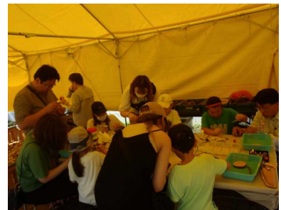
▽木工クラフトづくりの様子