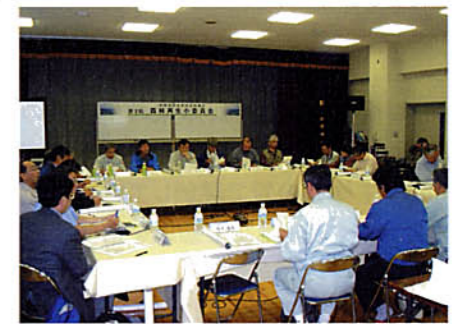
第2回森林再生小委員会(平成16年6月15日)

第2回森林再生小委員会が平成16年6月15日、塘路住民センターで開催されました。委員会には構成メンバー(個人14名、団体11団体、オブザーバー5団体、関係行政機関8機関)のうち、25名が出席しました。今回は、午前と午後に分けて委員会を開き、現地視察も行いました。午前の委員会で達古武地域の森林再生の調査・検討結果などについて報告を受けた後、今後森林再生モデル地区として試験的に森林再生に取り組んでいくNPO法人トラスサルン釧路の自然保護地と人工林を自然林に再生するための実験を計画している環境省のカラマツ人工林を視察しました。午後からは、再び塘路住民センターで委員会が再開され、雷別地区の森林再生について報告が行われました。その後、現地視察を踏まえたうえで、人工林から自然林への再生、エゾシカの被害対策等について、活発な質疑が交わられました。このほか、釧路湿原流域全体の森林再生や全体構想との関わりなどについても協議が行われました。