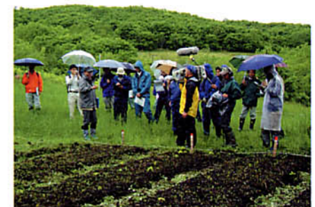
達古武地域現地視察