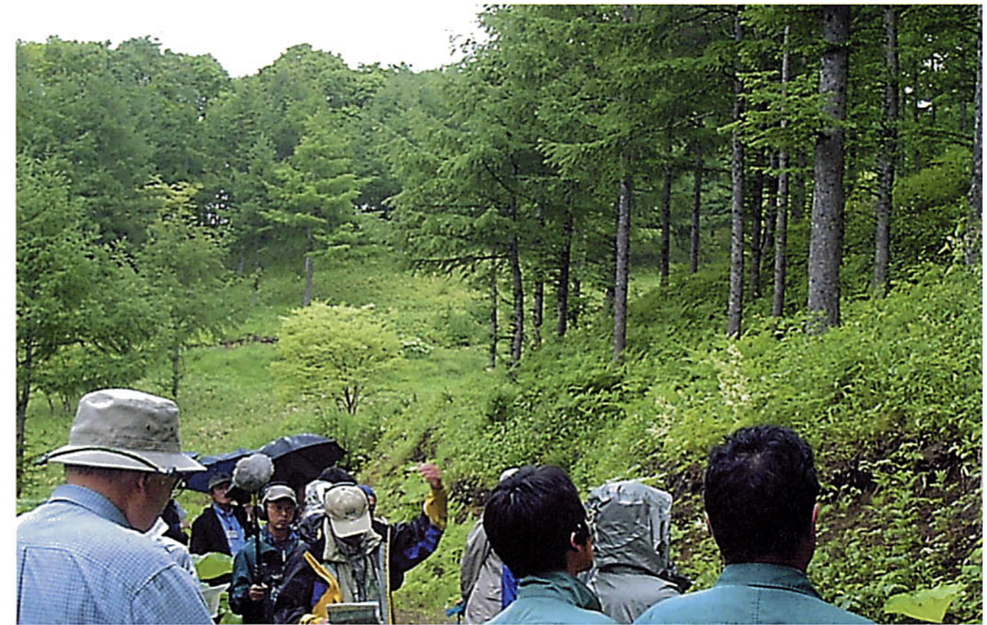
第2回森林再生小委員会 達古武地域現地視察