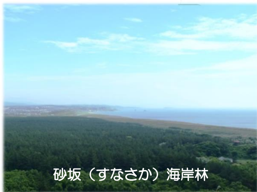
砂坂（すなさか）海岸林