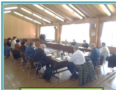
協議会総会（令和5年3月8日）

★当協議会は、大沼地域自然再生等モデル事業のランドデザインに基づき、森林の再生活動を行うことを目的として平成17年4月に組織されたものです。