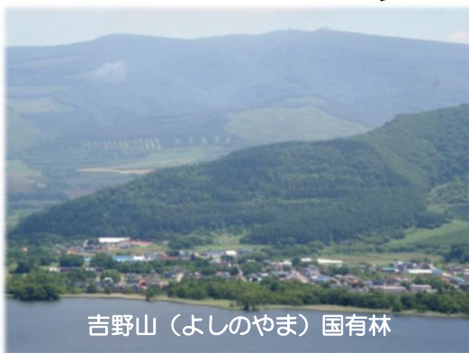
吉野山（よしのやま）国有林