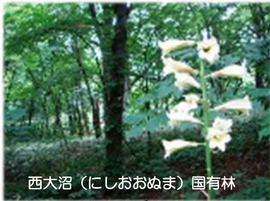
西大沼（にしおおぬま）国有林