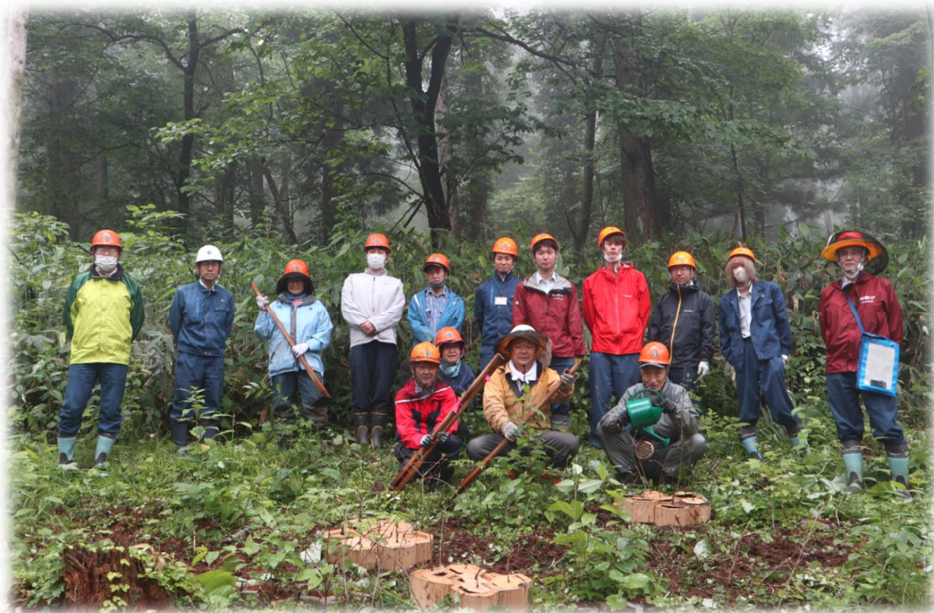
【令和5年6月 大沼自然豊かな森づくり協議会による植付作業】 (七飯町吉野山国有林)