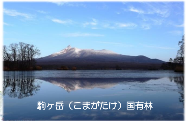
駒ヶ岳（こまがたけ）国有林