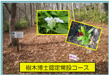
樹木博士認定常設コース

具体的には、森林環境教育の指導者の養成等のための 樹木博士認定会 の開催や研修会等を実施し、森林環境教育を推進します。また、多様性のある森林への再生活動（吉野山国有林）においても森林環境教育を実施することとしています。