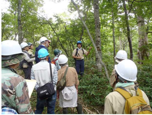
▽令和元年度の活動の様子（自然観察）