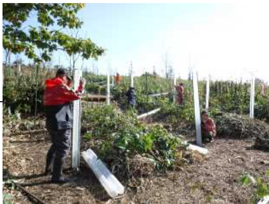
▽令和元年度の活動の様子（保護管組立て）

「雷別ドングリ倶楽部」会員募集 令和2年度に雷別国固有林で、「広葉樹の森林づくり活動」等に参加していただけるボランティアを次のとおり募集します。 シラルトロ湖に注ぐシラルトロエトロ川の最上流部にある雷別国固有林（川上郡標茶町雷別）には、林齢が70年を超える森林が広がっています。平成12年にその一部のドドマツ人工林が、立ったまま枯れてしまふ被害に遭い、笹地となつてしまふ箇所があり、当センターでは様々な種類の広葉樹を計画的に植栽する等、自然再生（森林再生）に取り組んでいます。