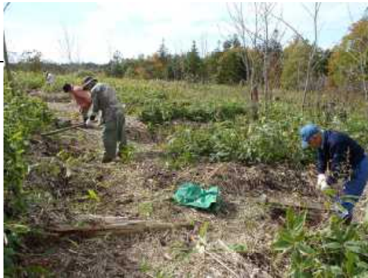
▽令和元年度の活動の様子（植樹）