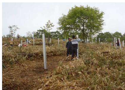
▽ツリーシェルター設置の様子