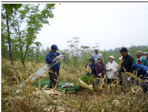
▽組立て方を説明している様子

植栽箇所は笹根や根株が多く、参加者の皆さんは、苗木を植える穴掘りに、大変難儀されていました。また、ツリーシェルターの設置では、杭や組立てた筒を運ぶのに、何回も坂道を往復する等、苦労等々ありましたが、参加した24名の皆さん