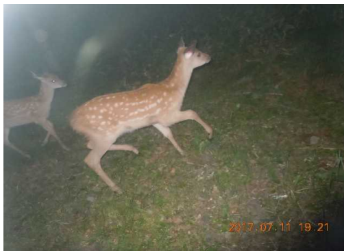
▽エゾシカの親子（平成29年7月）

当センターでは、パイロットフォレスト国有林等で、野生生物の生息状況を把握するため、モニタリング調査を実施しています。 この調査は、森林総合研究所北海道支所と連携して行っているもので、例年、7月と9月の2回、自動撮影カメラを用いて、中・大型ほ乳類等を撮影し、そのデータを収集しています。 今回の7月期の調査は、5日〜27日までの22日間を予定しており、赤外線に反応して撮影することができ、自動撮影カメラ6台を、林道沿いに設置することとしています。 調査結果については、まとまり次第、お知らせします。