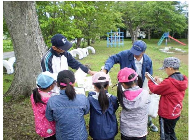
▽解説を聞きメモを取る児童の様子

子どもたちは、葉を触ってみたり、臭いを嗅いでみたりしながら、樹木の特徴等をつかんでいました。