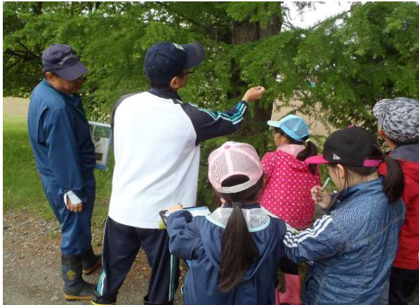
▽葉を触り感触を確かめる児童の様子

また、この「沼幌の自然・環境」の授業では、地域の再発見に活かすため、子どもたちがそれぞれ、テーマを設定しているとのこと、ユキムシやキツツキ、ドングリ等について、話題を提供しました。