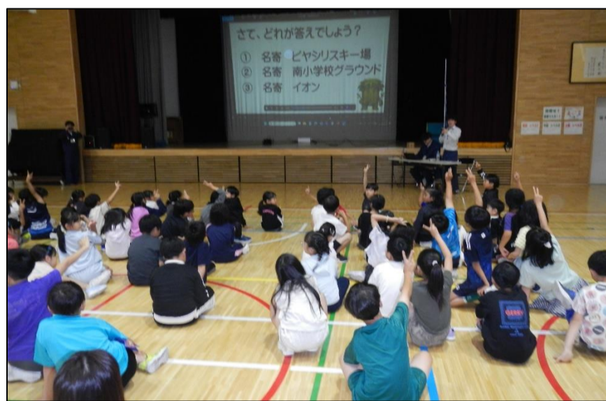
児童たちも積極的に授業に参加してくれました

令和8年6月30日、名寄市立名寄南小学校において、森林教室を開催しました。今回は「水」をテーマに、森林が果たす役割についての学習をしました。授業では、森林が雨水を土の中に蓄え、川へゆっくり流すことで水量を安定させる働きや、水をきれいに保つ役割について説明しました。また、洪水や土砂災害の防止など、森林が私たちの暮らしを支えていることも紹介しました。