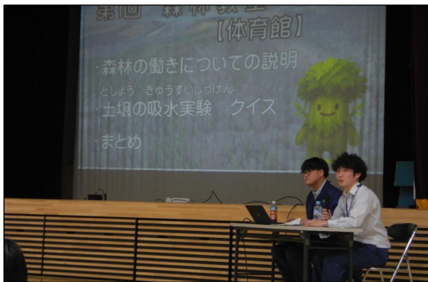
森林の働きを丁寧に伝える職員