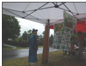
真剣に展示を見る来場者