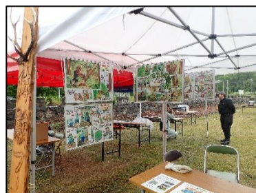
北の森漫画の展示

令和8年6月27日に下川町で開催された「森ジャム」に出展しました。当署は、下川町と森林組合が出展した林業機械体験ブースに合わせて、林業の仕事や林業機械について紹介する「北の森漫画」のパネル展示を実施しました。来場者は、実際の林業機械の体験と併せて展示することで、森林整備や木材生産を支える林業の役割への理解を深めていました。森林や林業への関心を高める良い機会となりました。