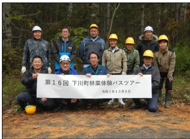
昨年の林業体験ツアー（集合写真）