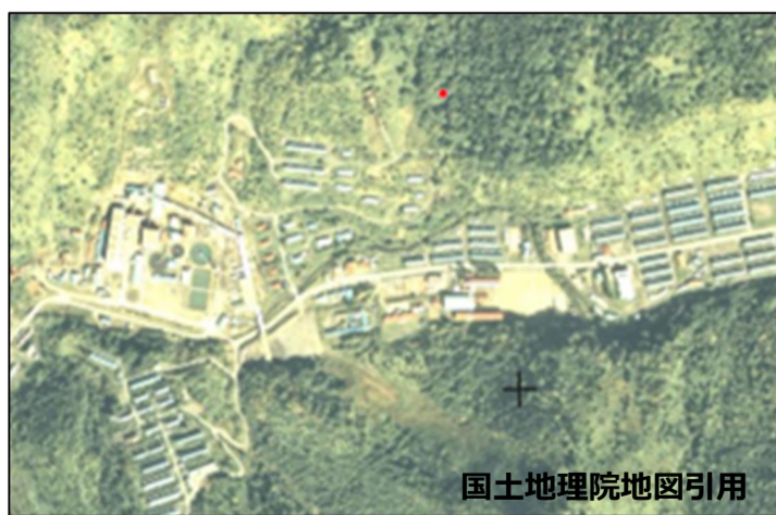
国土地理院地図引用