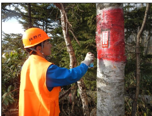
境界の目印として立木にスプレーする森林官

上川地方でも雪がちらつき最低気温がマイナスとなり、山の広葉樹等の木の葉が枯れ落ち、見通しが効くようになるこの時季の現場作業は、境界巡視が本格的に始まります。境界巡視とは、国有林野を管理するにあたり、国有林と民有地等との間に設置している境界標を、異常が無いかな現地森林官が行う確認作業です。