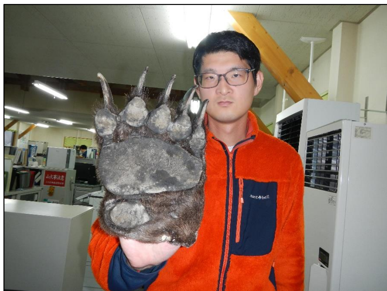
ヒグマの手を持つ職員