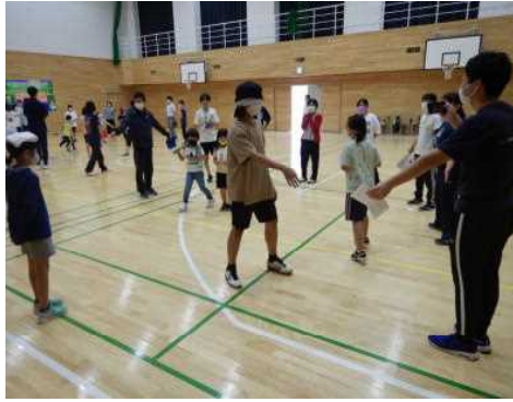
▽「コウモリとガ」実施の様子