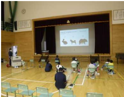
▽森林クイズの様子(小1~小4)

正解を発表する度に、児童生徒の「喜」憂する声が室内に響き渡るなど、楽しみながら学習してもらえたのではないかと思います。