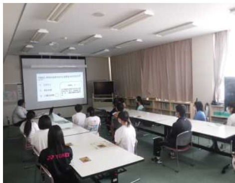
▽森林クイズの様子(小5~中3)