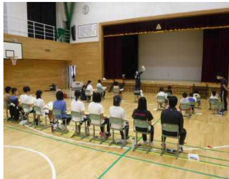
▽食物連鎖について説明する様子

正解を発表する度に、児童生徒の「喜」憂する声が室内に響き渡るなど、楽しみながら学習してもらえたのではないかと思います。