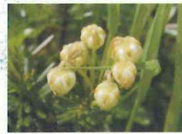
アオノツガザクラ