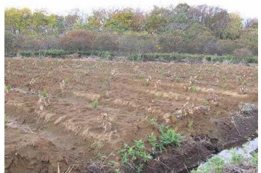
未立木地への植栽 （アカエゾマツ・カシワ）