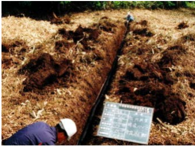
あんきょ 暗渠排水管設置作業