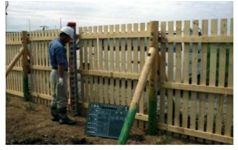
苗木を風から守る 防風柵設置