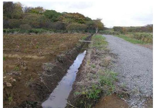
明渠工と作業道新設