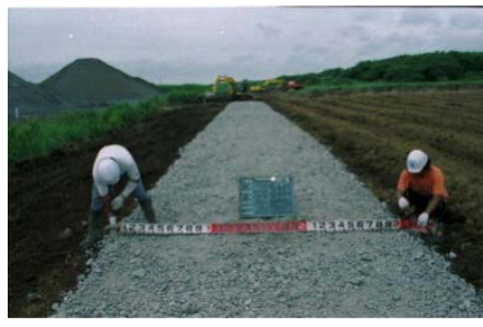
作業道作設（砂利敷き）