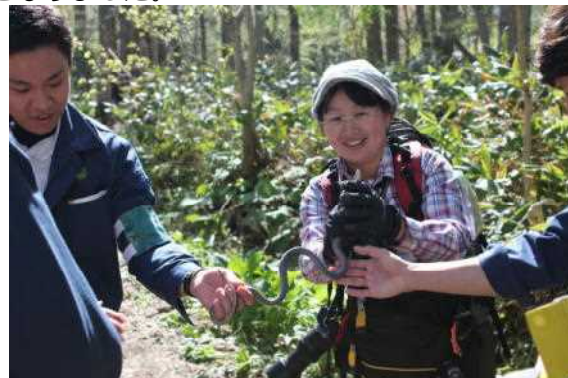
へびにも負けずに勉強