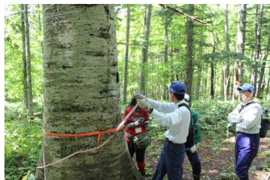
林業の基礎知識の習得