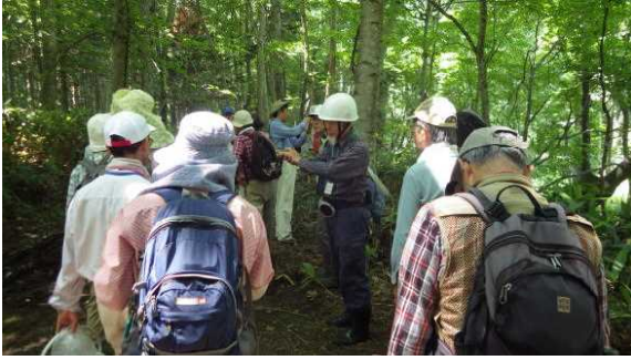
樹木の成り立ちと土(テフラ)の関係の現地講義