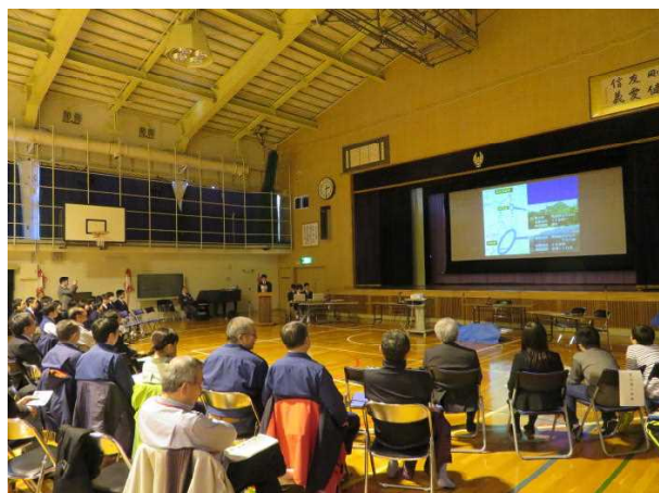
たくさんの方々の参加がありました

発表後は、全参加者で「もりを観察、学ぶ、育てる」をテーマにパネルディスカッションを行い、有意義な時間を過ごしました。