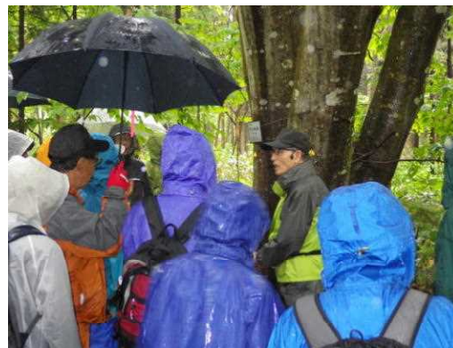
雨にも負けず・・・