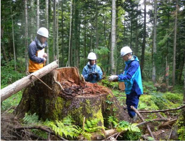
森林施業について

北海道森林管理局では、学生が森林管理局の実際の行政事務に接することにより、学習意欲を喚起し、高い職業意識を育成するとともに、国有林野事業及び林野行政に対する理解を深めてもらうことを目的としてインターンシップを実施しています。今年、札幌工科専門学校生2名の方を、当センターが5日間受け入れ、森林施業、動物調査、生産、治山・林道、森林ふれあい、森林保全等幅広い分野の業務を体験しました。あまり天候には恵まれませんでした、最後まで熱心に説明を聞いてくれました。