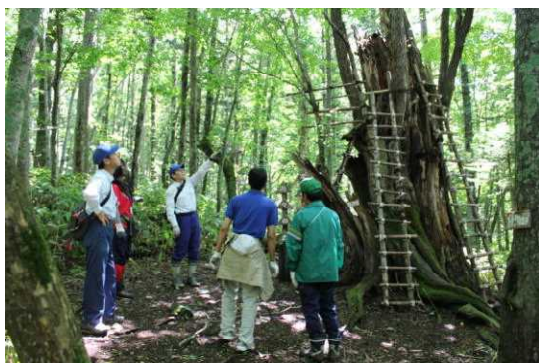
森林・樹木のメカニズムの説明

森林に関する普及啓発の担い手となる人材育成のため「札幌市定山溪自然の村」が開講している「フォレストスクール」において、センター職員が講師となり、林業の基礎知識、樹木のメカニズム、森林植生等について講義を行いました。