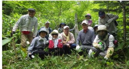
NPOシーズネットの下刈作業