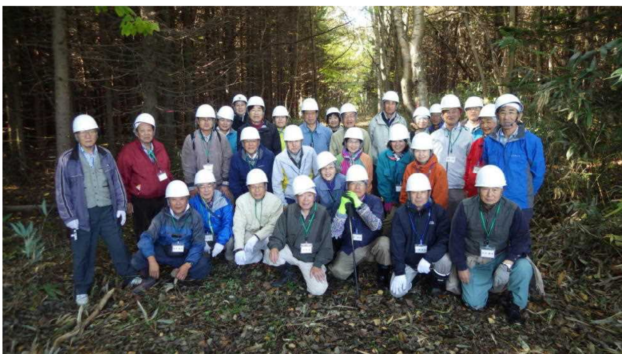
森林での作業は楽しい！（第3回野幌森林づくり塾）