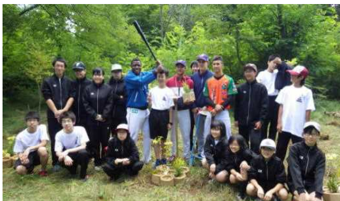
植樹を通じて交流を深めました