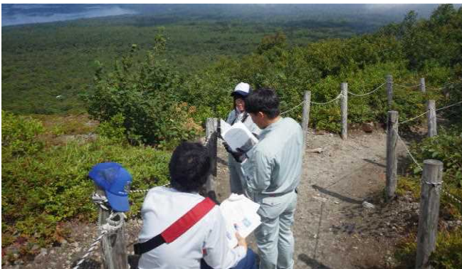
樽前山から台風被害跡を確認