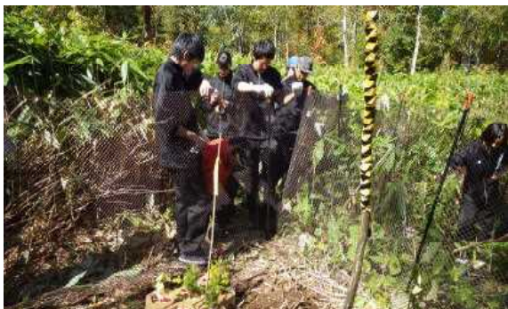
効果てき面の防護柵の設置

定山溪中学校で平成22年から、奥定山溪の森林で採取したタネから育てていたミズナラやエゾマツでポット苗木を作り、定山溪の森林へ植栽しています。