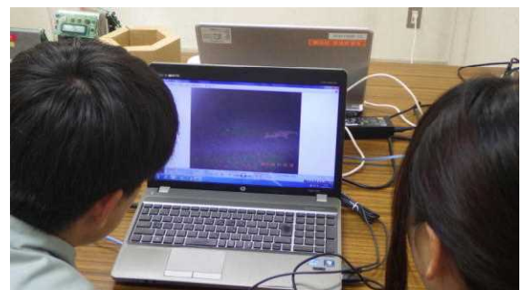
自動撮影による動物調査の解析