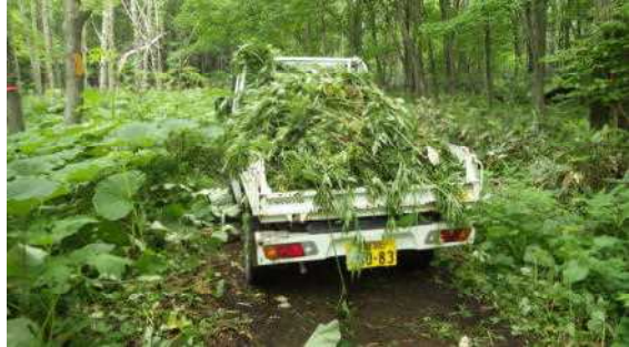
オオハンゴンソウ山盛りのトラック