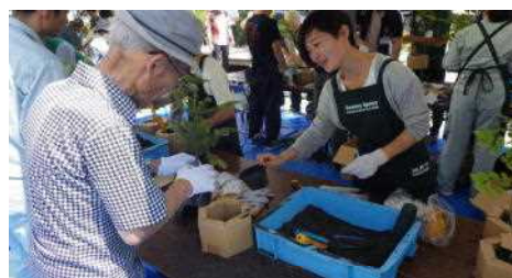
学生ボランティアによるサポート