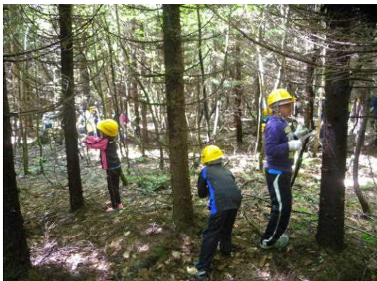
慣れないながらも懸命に

当センターは森林管理署に協力し、森林教室に講師を派遣して支援しています。今年は3年生の枝払い作業体験、4年生の測樹体験、5年生の森の探索、6年生のポット苗による植樹に協力しました。生徒の皆さんは、森林教室の体験を通じて、森林の役割や大切さについて学び、考える機会になっています。