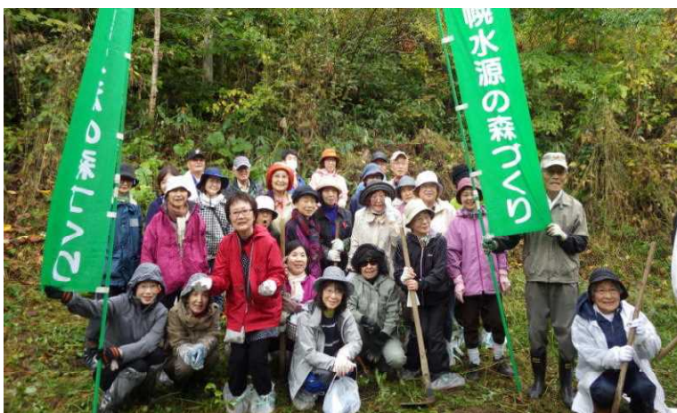
みなさん、心地よい汗を流しました