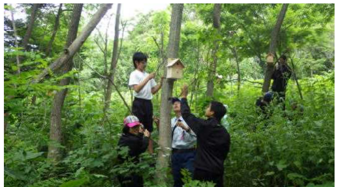
自分たちで作成した巣箱の設置