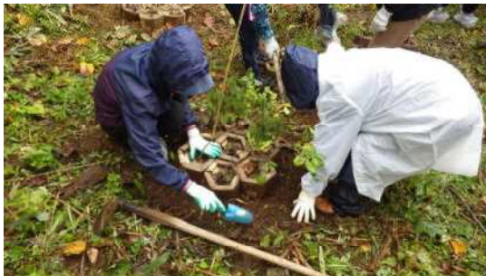
ポット苗木の植栽

また、作業終了後は、定山溪ダム管理支所のご案内で、ダム見学をさせていただきました。水源の恵みを実感しました。