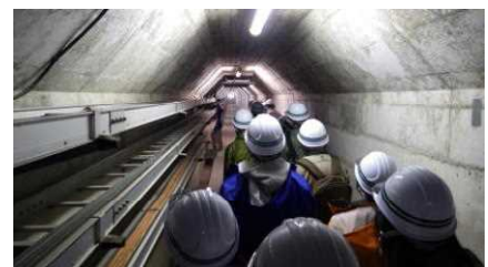
作業終了後のダム見学