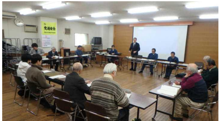
各団体からいろいろな意見が出されました

意見交換では、森林づくりに係る情報提供、エゾシカ問題、ダニ対策等幅広い分野での様々な意見が出されました。