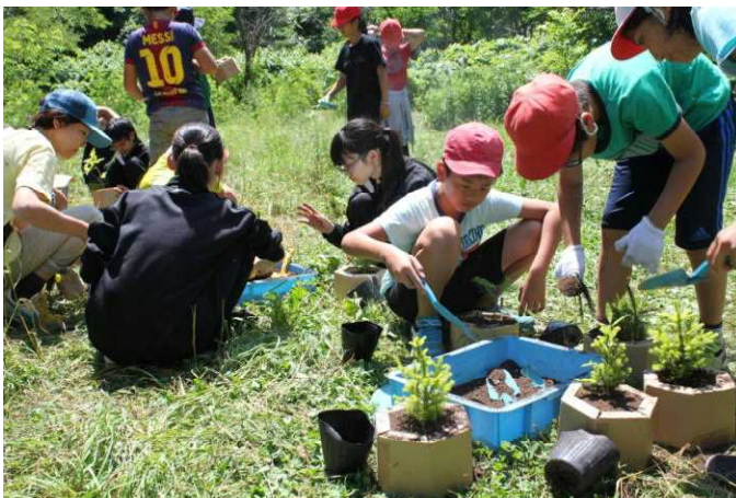
来年は私たちも夢の森で活動します

定山溪小学校の5・6年生を対象に定山溪中学校の活動地である国有林(夢の森)で、ポット苗による植樹を行いました。当日は、中学校1年生も指導に訪れてくれました。