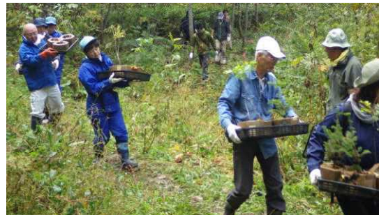
運搬が結構大変 m(_ _)m