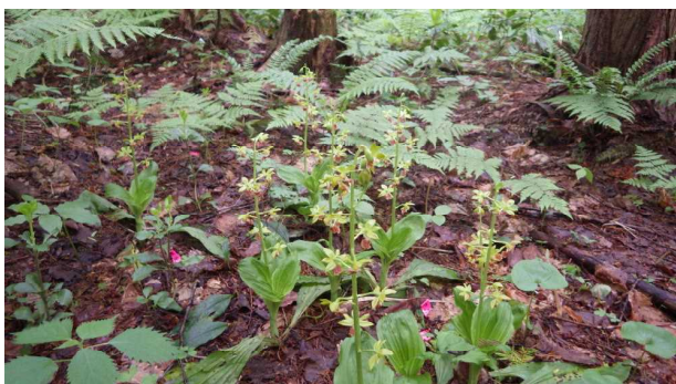
日当たりの良いところには群生