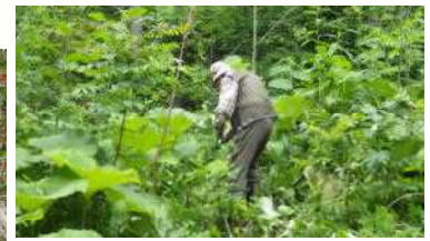
暑い中、下刈に汗を流す