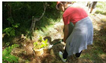
大きく育ちますように

湿度が高く、羽虫が異常に飛び回る悪条件の中ではありますが、最後の水やりまで一生懸命に作業を行っていました。