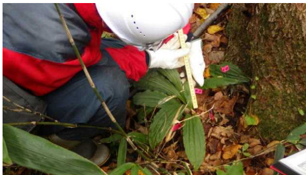
葉の長さや幅を計測