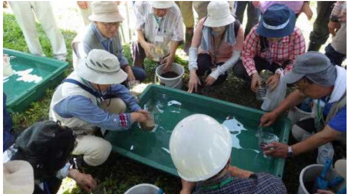
童心に戻って土を十分に洗浄する