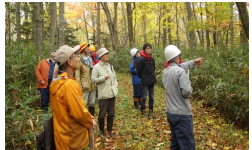
委員の方が現地で検討

野幌森林再生プロジェクトの大きな柱として、平成18年から、台風被害森林の回復状況を把握するために、学識経験者による「野幌自然環境モニタリング検討会」を設置しています。①森林植生、②歩行性甲虫、③菌類、④野生動物の4項目についてモニタリング調査を実施し、回復度の検証や野生動物の森林への影響について検討しています。