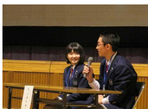
緊張しながらも・・・