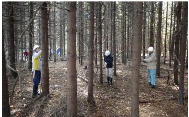
林内がスッキリしてきました