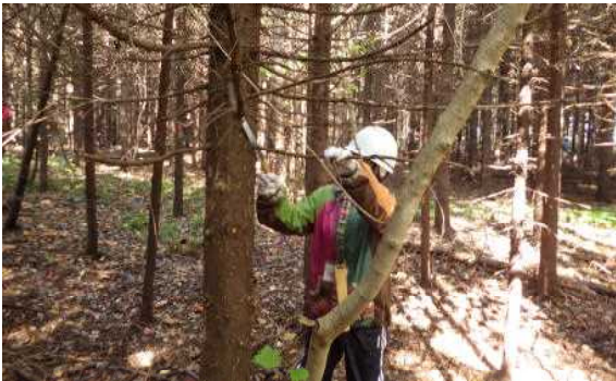
ノコギリの使い方をマスター

実際の森林の中での枝払い作業を通じて、刃物の取り扱い方、安全で効率的な作業の仕方など森林づくりの基礎を学びました。筋肉痛になるような大変な作業ではありましたが、「林内がきれいになっていくことは快感だ」などの声が聞かれ、心地よい汗を流しました。その後、センター職員が講師になり、改めて森林・林業・ボランティア活動についての講義を行いました。