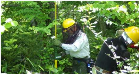
北海道ボランティア協会の成長量調査

「団体型森林づくり」協定に基づき、植栽箇所の下刈などの保育作業、成長量調査などに取り組んでおり、センター職員が現地で技術指導などの支援を行いました。