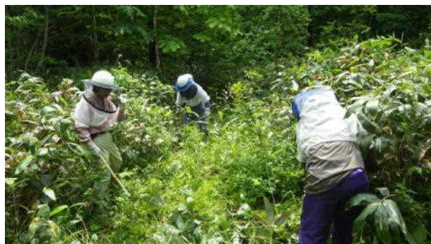
暑い中、防蜂網・手袋を着用して作業

当日は、初夏を思わせる晴天のもと、防蜂網、防蜂手袋などハチ刺され対策を万全にして作業を行い、みなさん爽やかな汗をかいていました。