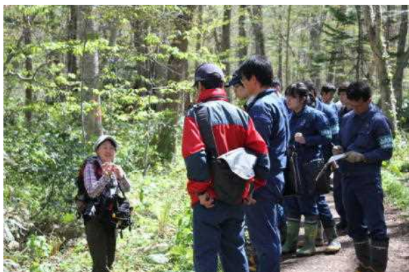
引きつけられる講師の話

当日は天候にも恵まれ、近隣の森林管理署の若手職員を主体に総勢18名の参加があり、参加者は日常の業務の中では発見できない森林のおもしろさを実感するだけでなく、一般市民目線での森林の見かたについても十分理解できたものと思われ、有意義な実施内容となりました。