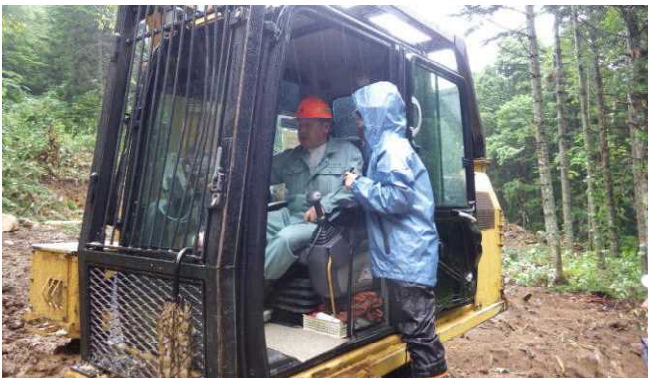
初めて見た高性能林業機械