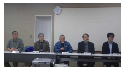
モニタリング室内検討会

平成29年度モニタリング調査の結果報告及び平成30年度モニタリング調査の進め方などについて検討を行いました。