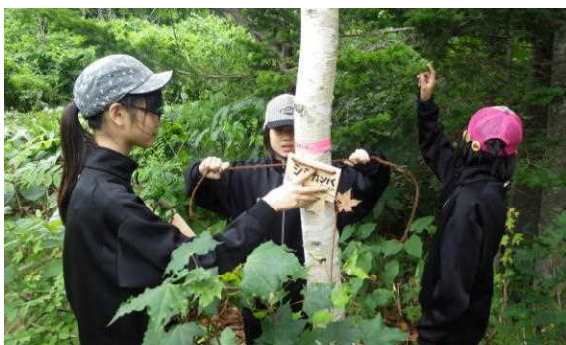
樹名板の取り付け