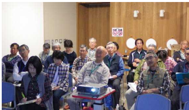
熱心に聞き入る塾生