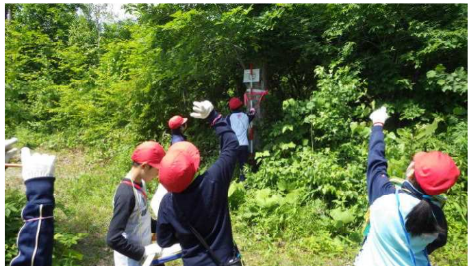
木のてっぺんは少し離れば見える