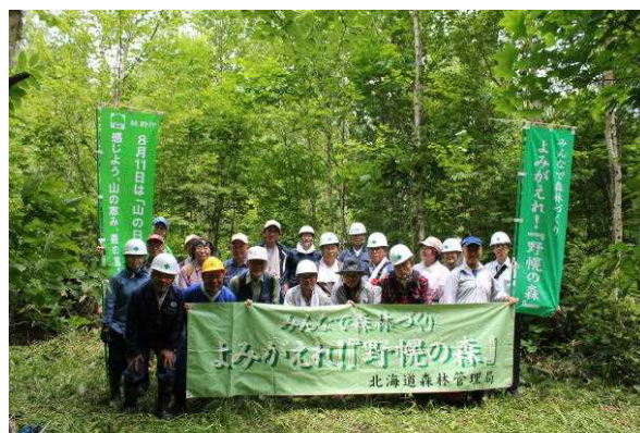
みなさん、お疲れ様でした