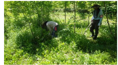
野幌森クラブの下刈作業