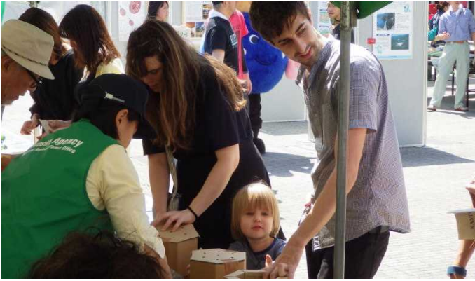
外国人のご家族も興味津々です