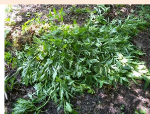
採取したオオハンゴンソウ

コロナウイルスが終息しない場合には、開催出来ない事もあり得ますので、御了承下さい。