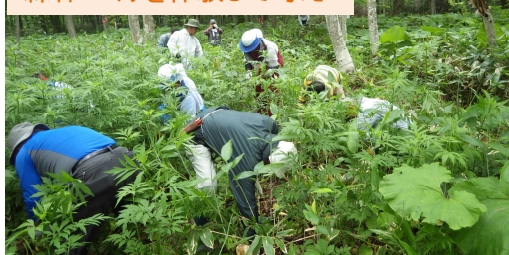
森林づくりを体験して考え

※日程、集合時間、集合場所、実施内容等については変更になる場合もあります。申し込みされた方には、毎回事前に日程等をご連絡いたします。