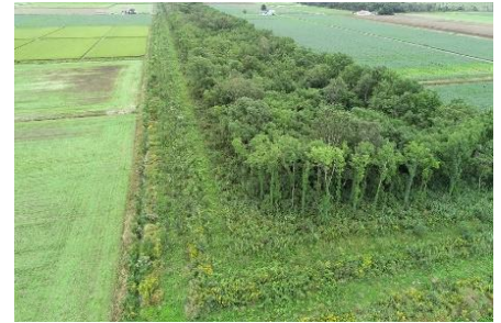
整備された防風保安林 (美唄市：岩見沢担当区)