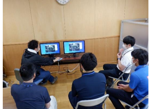
全天球カメラを使用した林況調査 (市町村林政連絡会議にて)