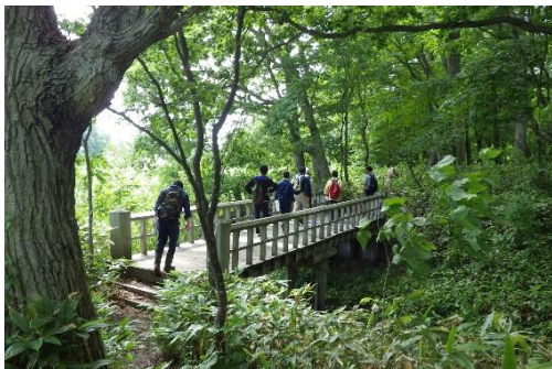
利根別自然休養林 (岩見沢市 岩見沢担当区)

国民の皆さまが身近に森林とふれあえる場として、管内に自然休養林、自然観察教育林、野外スポーツ地域などのレクリエーションの森を設定しています。