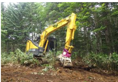
かき起こし実施状況

種子の定着を促す更新補助作業として地表面の笹等を除去する「かき起こし」や、伐根をひっくり返す「根返し」を行うことで天然力を活用して次世代の樹木を更新させることを目指しており、今後更新状況の検証を行って参ります。