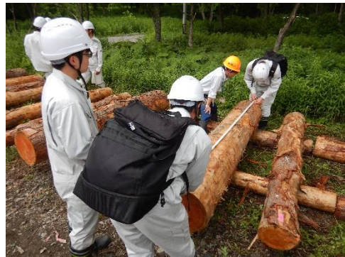
岩見沢農業高校 インターンシップ