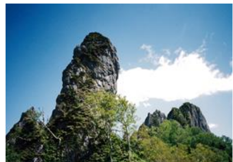
嵯山高山植物希少個体群保護林 (芦別市 惣芦別担当区)