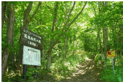
馬追自然の森自然観察教育林 (長沼町 由仁担当区)