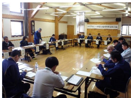
石狩空知地域林政連絡会議