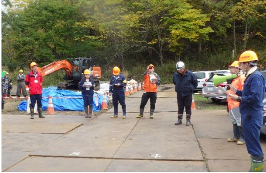
合同労働安全パトロール

国有林のフィールドや技術力を活用し、森林・林業技術を支援する森林総合監理士（フォレスター）等の育成を推進するとともに、北海道空知総合振興局とも連携しながら、市町における森林・林業技術の育成に向けた取り組みを実施しています。