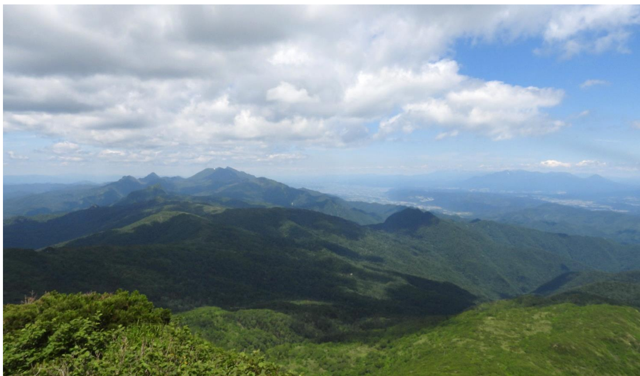
夕張岳頂上からの風景