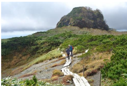
夕張岳生物群集保護林 (夕張市 夕張岳担当区)

管内では、ユウパリコザクラ、ユウバリソウなどの生息地として有名な夕張岳生物群集保護林や嵯山高山植物希少個体群保護林、月形スギ希少個体群保護林など合わせて17箇所が保護林に設定されています。