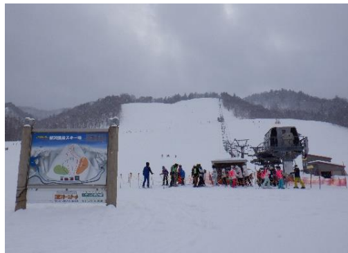
桂沢スキー場 (三笠市 幾春別担当区)