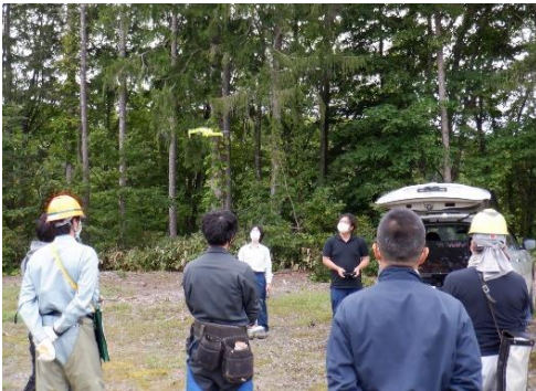
市町村森林整備計画実行管理推進 チーム活動でのドローン操作説明