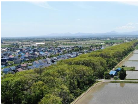
南幌自然観察教育林 (南幌町 由仁担当区)