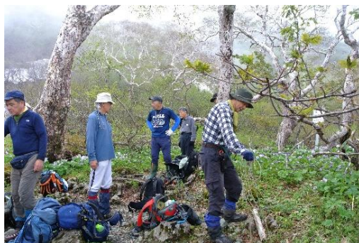
夕張岳森林パトロール (夕張市 夕張岳担当区)