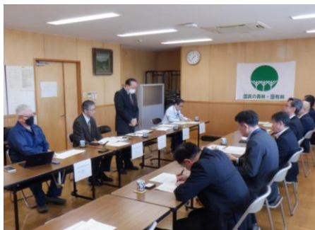
地域林業の現状共有にむけた 打ち合わせ

このため、民有林行政を担当する振興局や市町などと連携して、流域の課題や二-ズの的確な把握、森林計画等の策定のための意見調整などを進めています。