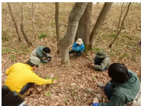
マレウレウの森 (栗山町 紅葉山担当区)

国有林では、森林とのふれあいや企業の社会的責任活動などの国民の多様な要請に応えるため、協定締結によるフィールドの提供や必要な技術指導を行うなど国民による国有林野の積極的な利用を推進しています。空知森林管理署では6協定の締結をしています。