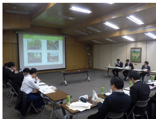
写真 第2回検討会の様子