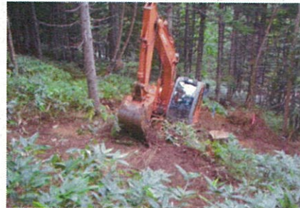
図1 試験地の施工(小面積地がき)中

森林技術・支援センターでは森林総研北海道支所と共同で、伐採による照度のコントロールと小面積の地がきを組み合わせた新たな手法により多様な樹種を更新させることを目的として試験しました。