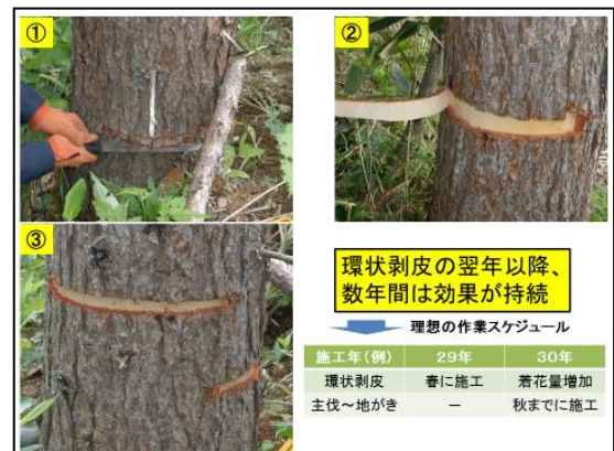
図-3 環状剥皮の実施方法

環状剥皮は、①形成層まで鋸で切れ目を入れ、②数cmの帯状に樹皮をはがしていきます。③これを上下に半周分実施することで、水や養分の移動を制限させ、着花量を人為的に増やすことが可能です。剥皮を花芽の分化前に実施することで、翌年以降、数年間は効果が持続します。