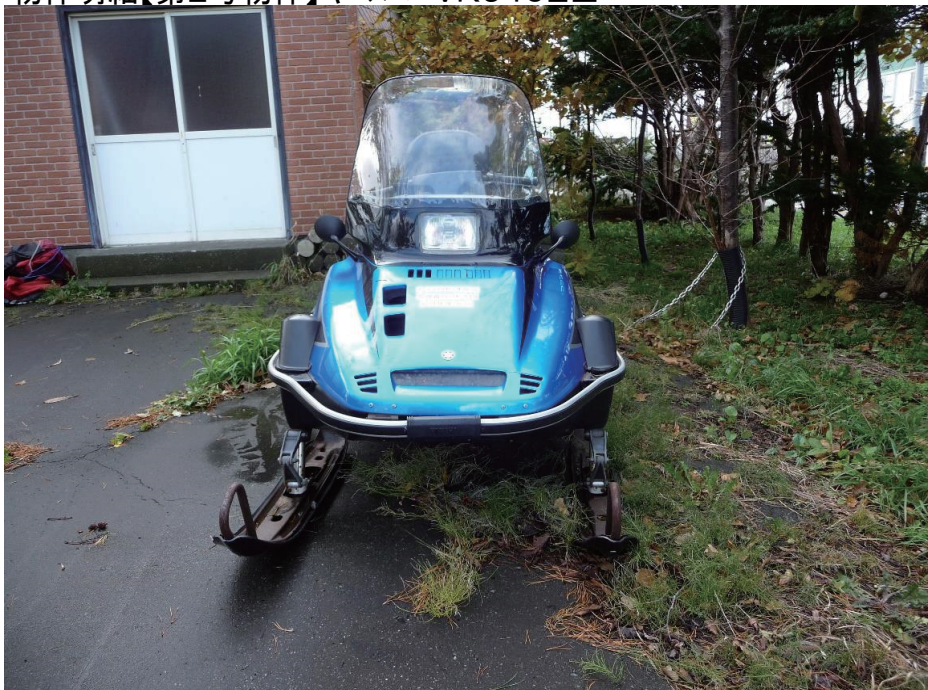
物件明細【第2号物件】ヤマハ VK540EⅢ