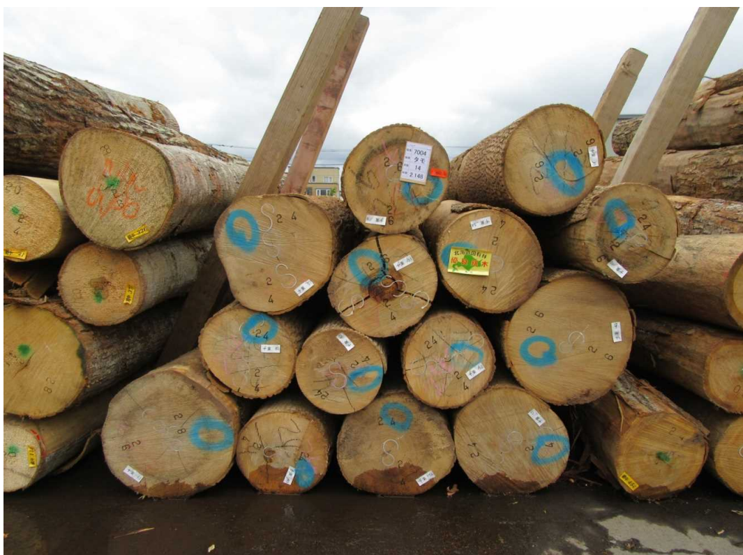
5122~3 メジロカバ、5124 ミズナラ