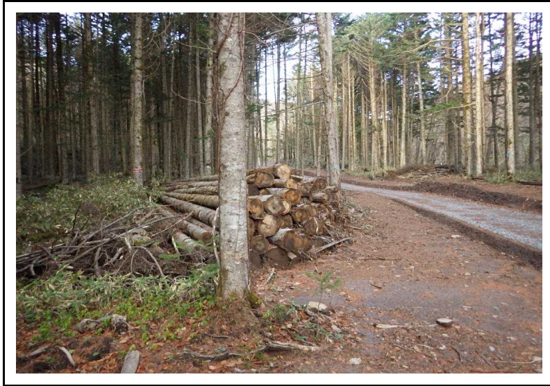
土場番号 7 (R2.11.12撮影)