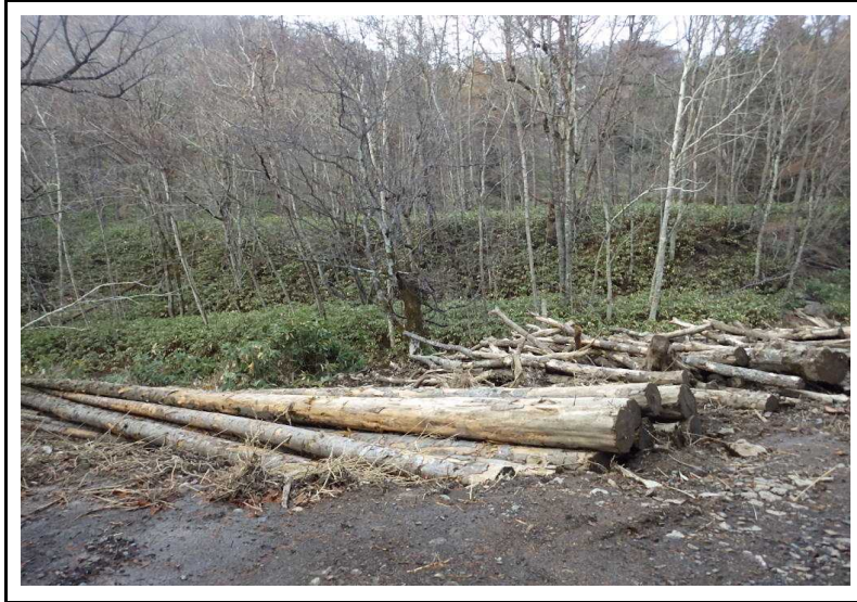
土場番号 1 (R2.11.12撮影)