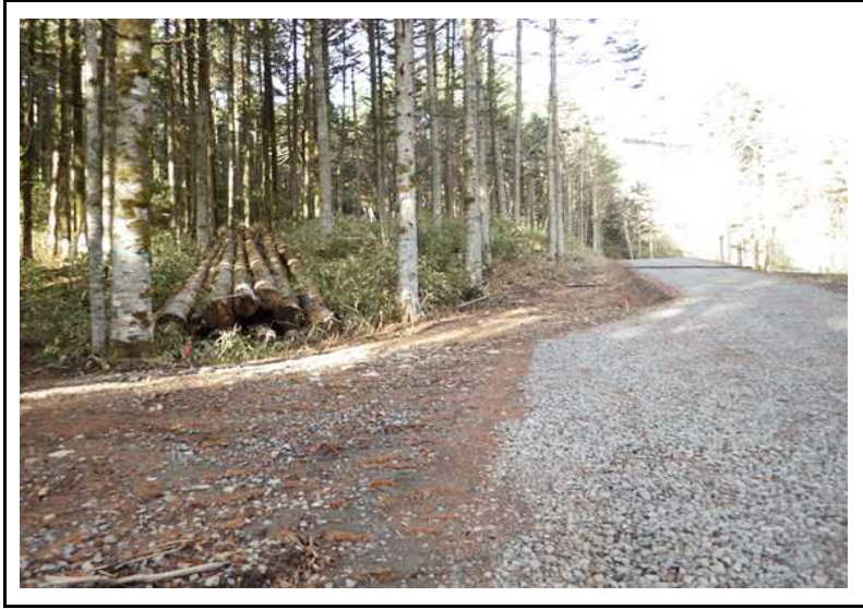
土場番号 9 (R2.11.12撮影)