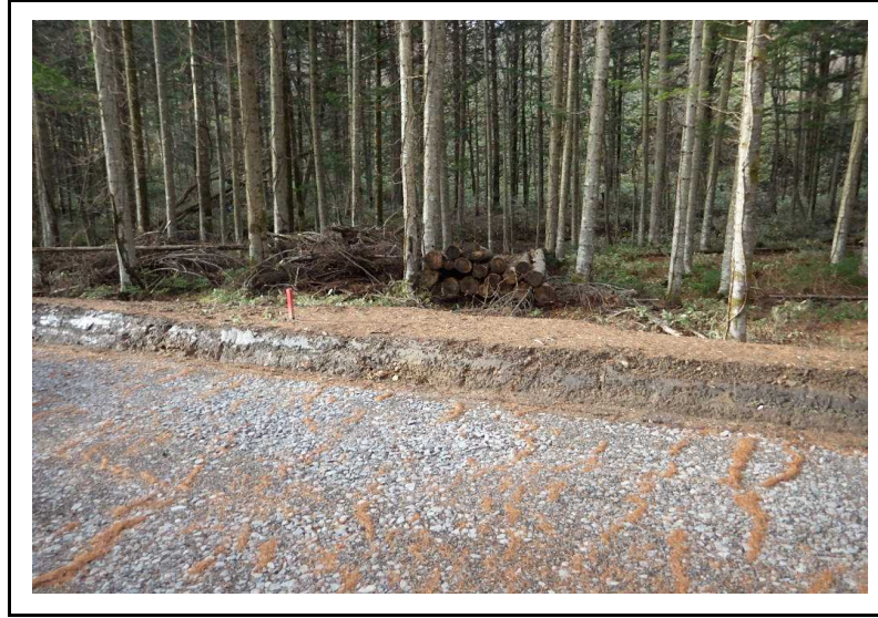
土場番号 6 (R2.11.12撮影)