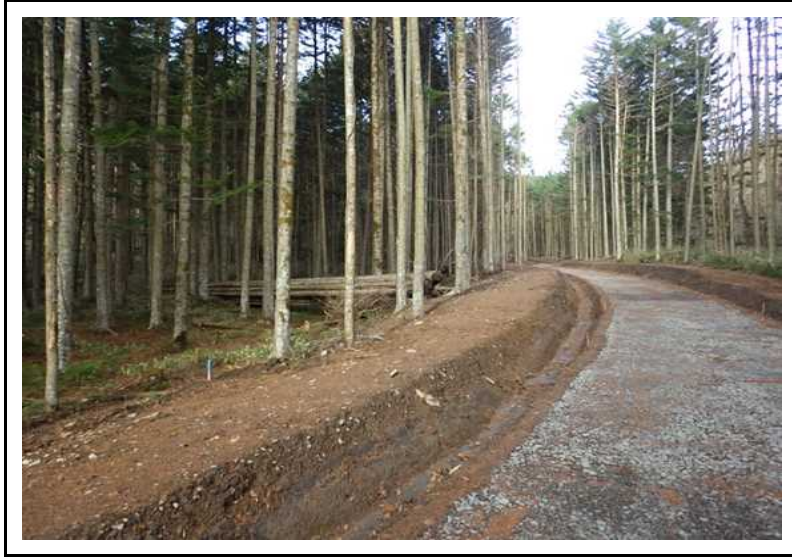
土場番号 5 (R2.11.12撮影)