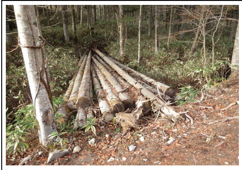
土場番号 3 (R2.11.12撮影)