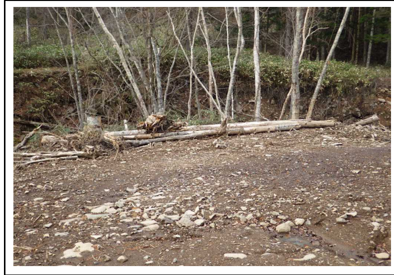
土場番号 2 (R2.11.12撮影)