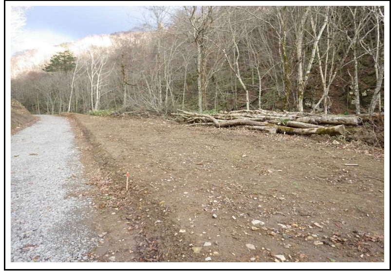
土場番号 10 (R2.11.12撮影)