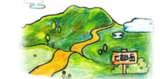
令和8年度 里程図 檜山森林管理署・乙部地区