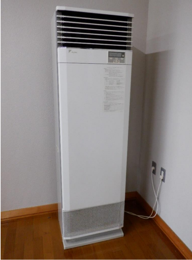
既存暖房機全景（参考）