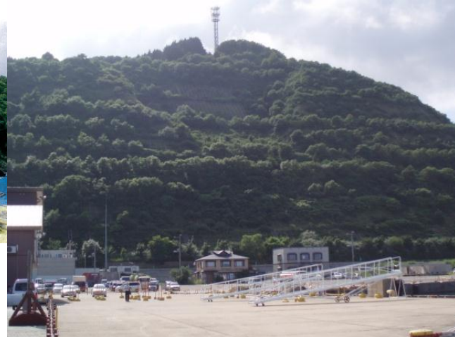
現在の状況 (平成25年)