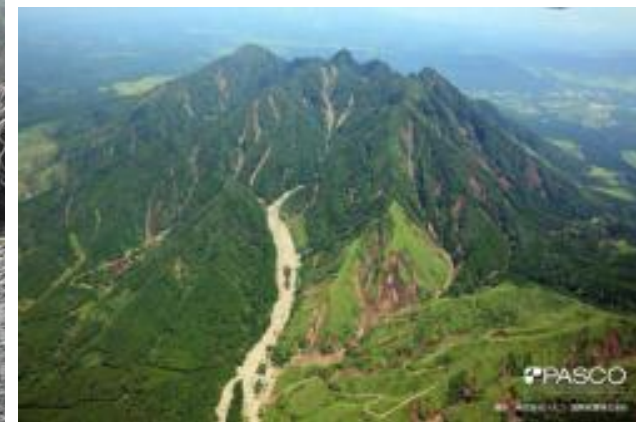
治山事業施工地内の根子岳の崩壊状況(平成24年)