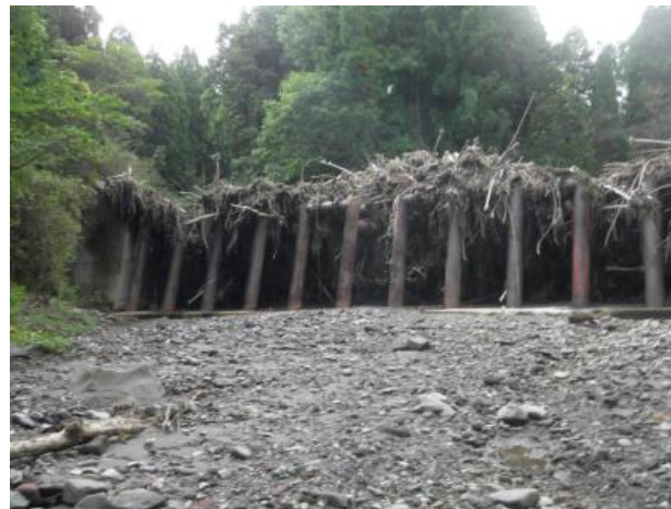
土石流及び流木を捕捉したスリットダム