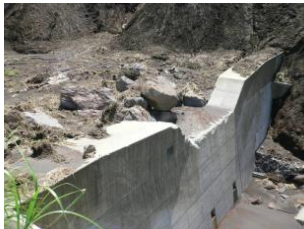
土石流の流下を抑制した治山ダム