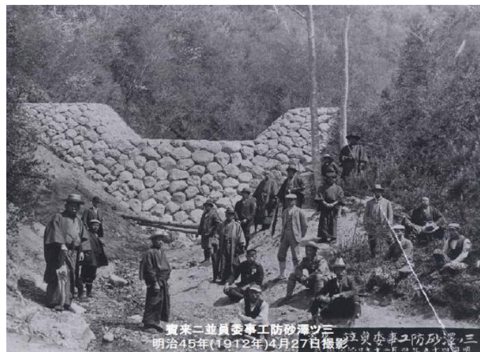
完成当時の谷止工