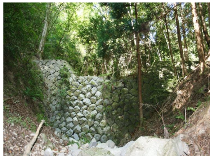
現在の谷止工状況