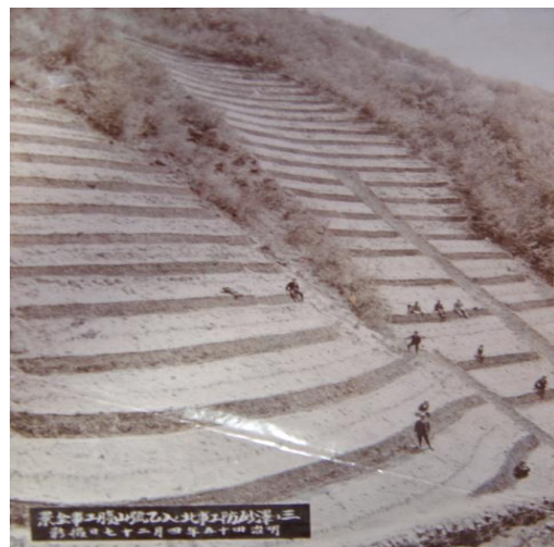
完成当時の山腹工