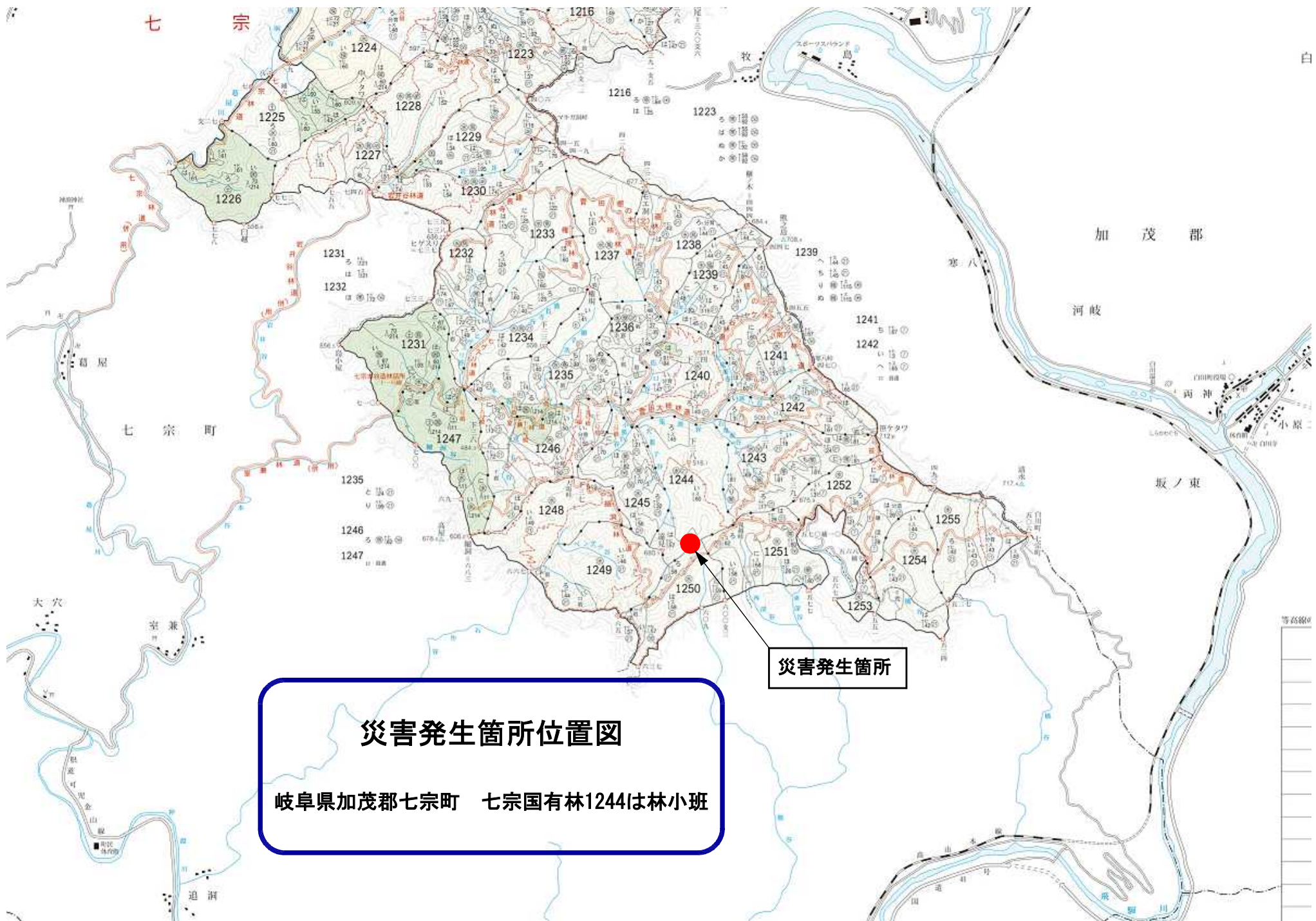
災害発生箇所位置図 岐阜県加茂郡七宗町 七宗国有林1244は林小班