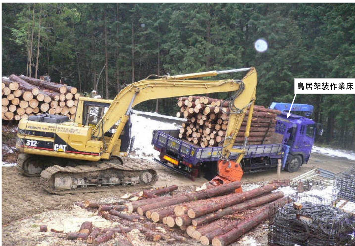
災害発生箇所の全景