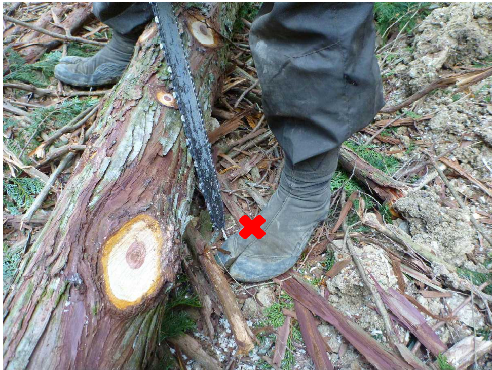
( 被災時の状況 )