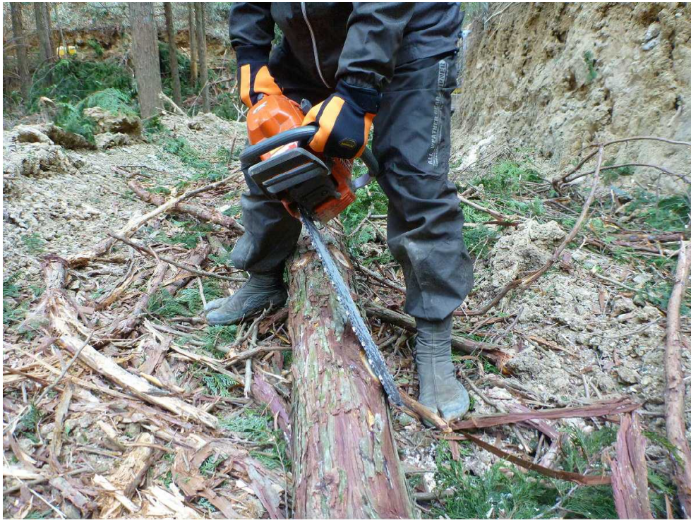
( 被災前の作業姿勢 )