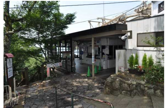
金華山ロープウェー山頂駅 (往復料金: 1,100円)