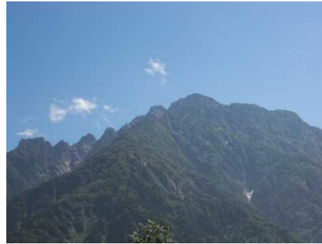
中山山頂から剱岳を望む