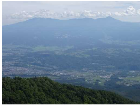
見晴岳からの景色