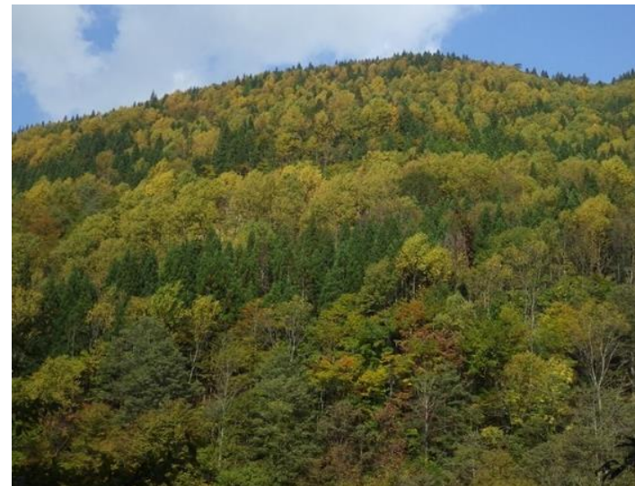
針広混交林への誘導