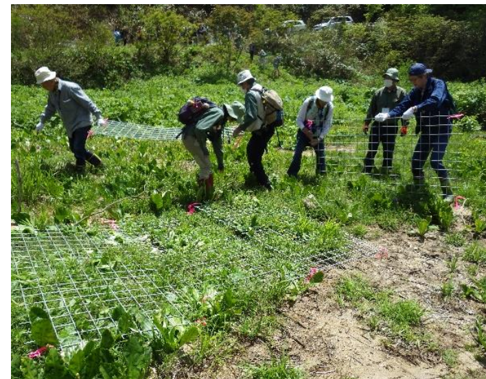
水無湿原保全整備 (南砺市利賀 水無国有林)