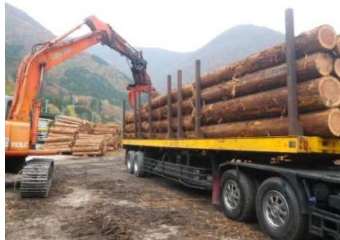
中間土場からトレーラーでの運材 (富山市 楡原地区)

安定供給システムによる販売等林産物の持続的・計画的な供給に取り組みます。また森林土木工事等における木材利用を推進します。