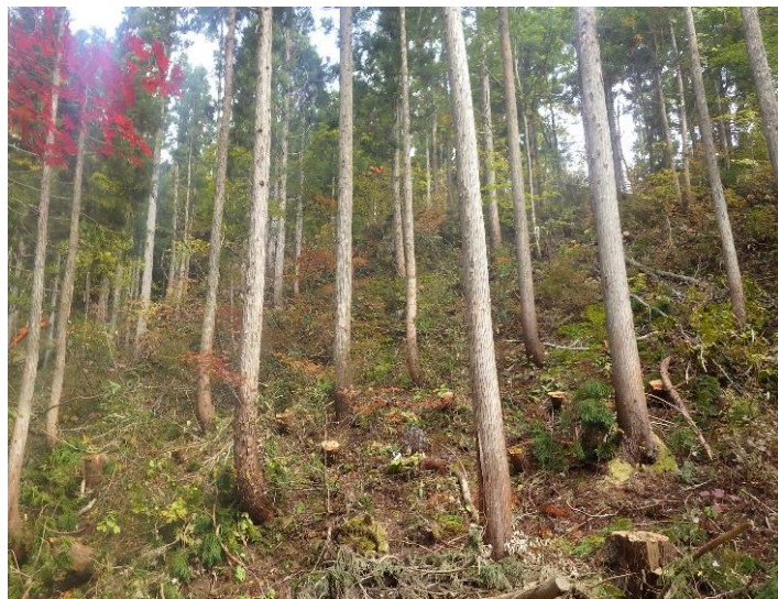
過密となった林分の間伐

森林の多面的機能を持続的に発揮させるため、地域管理経営計画等に基づき、立地や林分の状況などに応じた適切かつ効率的な施業により多様で健全な森林づくりを推進します。そのために、森林吸収源対策として必要な間伐や、天然力の活用も含めた育成複層林への誘導等に取り組むとともに、効率的な施業の実施に必要な路網の整備、既存施設の長寿命化対策を推進します。