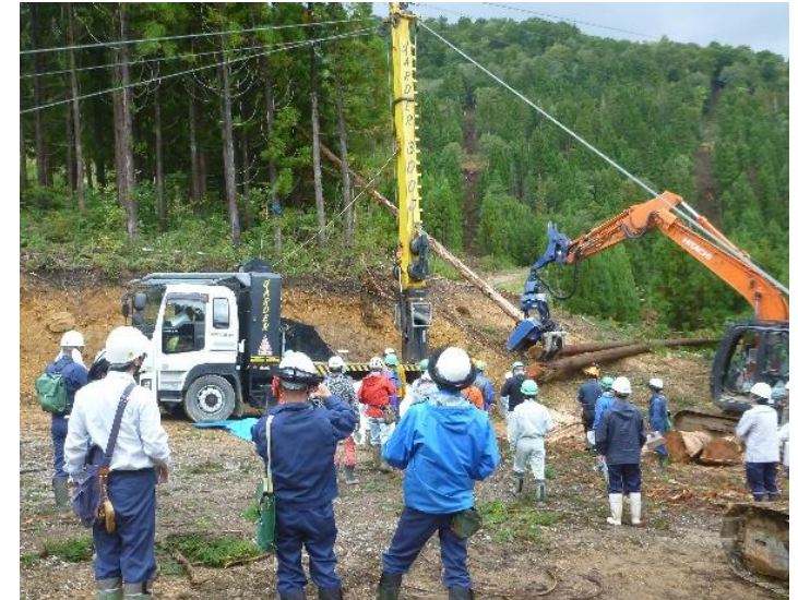
生産性向上実現プログラム現地検討会 (富山市 長棟国有林)