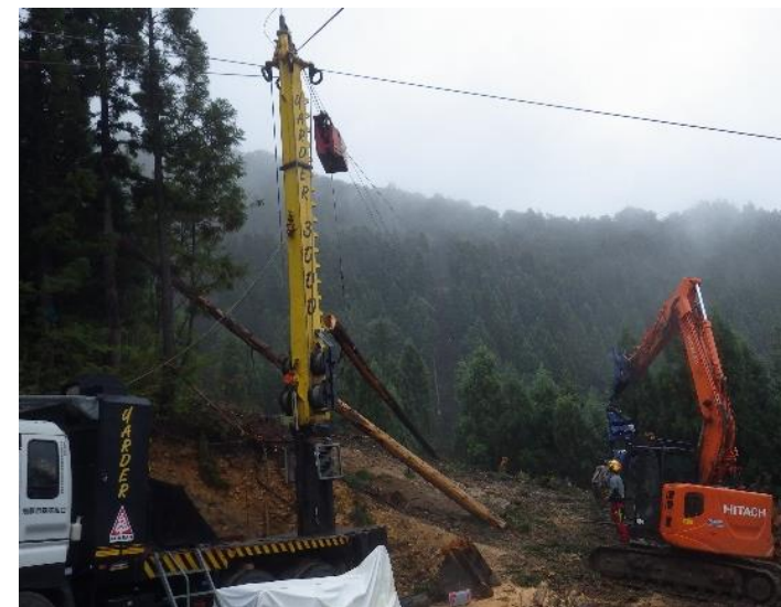
作業道とタワーヤード-を併用した集材