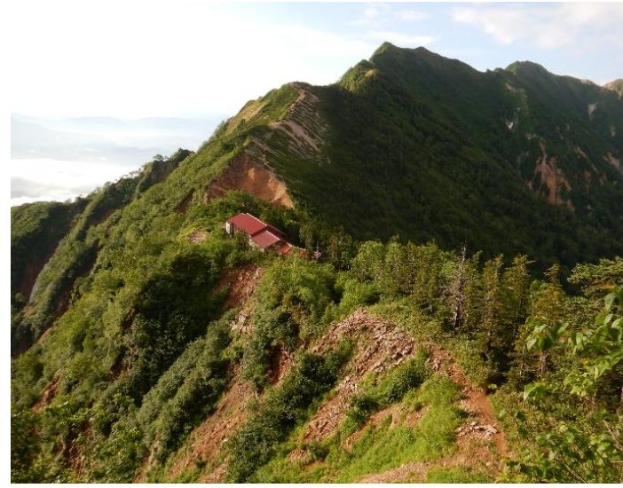
後立山の山小屋 (立山町 ブナ坂国有林)