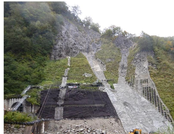
常願寺川上流（スゴ谷）民直山腹工事 （富山市 有峰真川谷割地区）