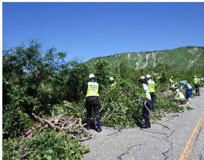
ミヤマハンノキ除伐作業 (立山町 アルペンルート沿い ブナ坂国有林)

また、大沢野国有林にて地域住民から要望を受けたクマやサル等の鳥獣対策について、関係団体による社会貢献活動の緩衝帯整備を通じて、引き続き取り組みます。