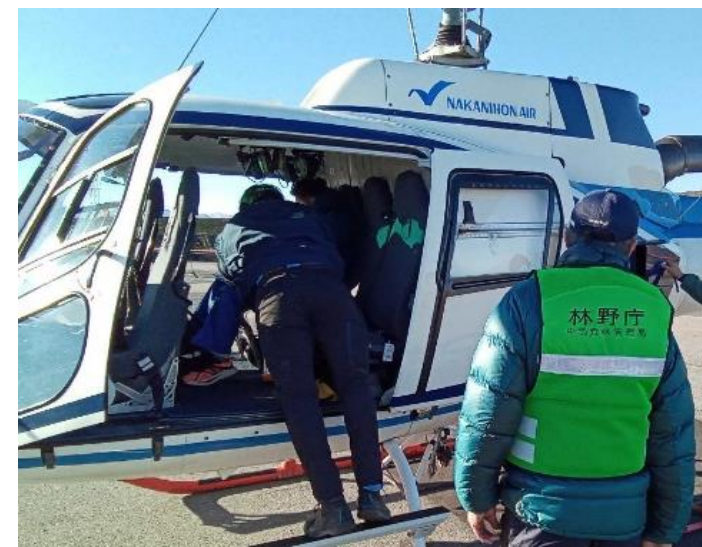
能登半島地震に伴うヘリによる富山県との 合同山地被害調査（R6.1.5）