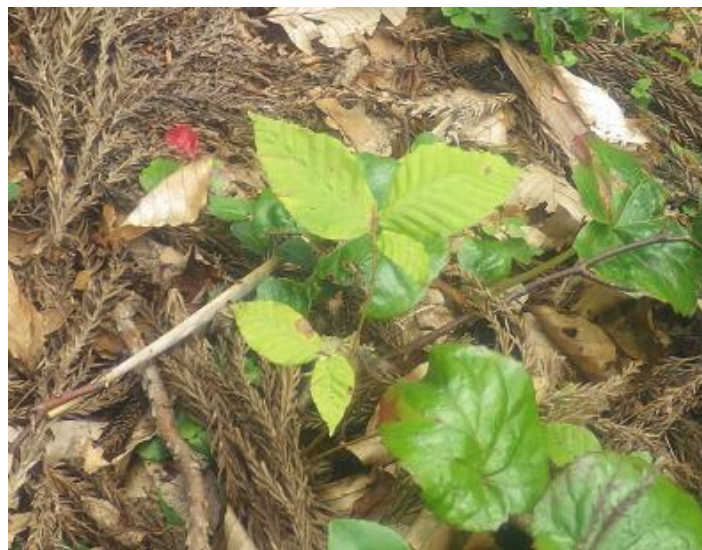
天然更新による発芽したブナ (富山市 長棟国有林)