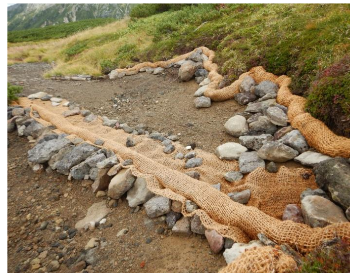
雲ノ平植生復元 ロール工法 (富山市 黒部谷割国有林)