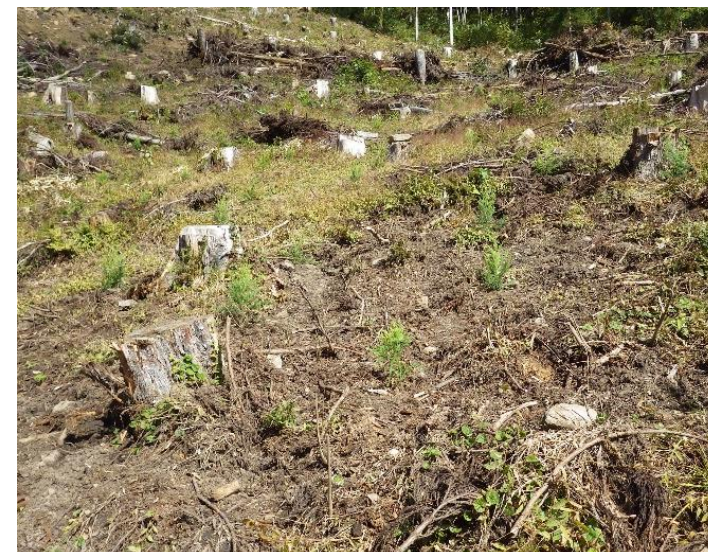
植栽した富山県産無花粉スギ