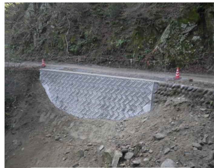
長棟林道改良工事