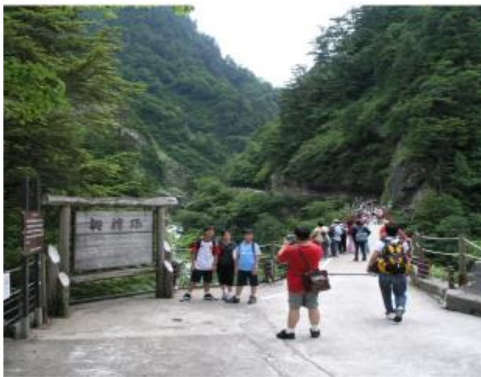
樺平風致探勝林 (黒部市 黒部奥山国有林)