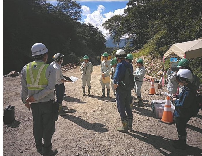
低軌道衛星通信導入実践の現地研修会 (富山市 有峰真川谷割地区)

製品生産の生産性向上、針広混交林への誘導、ICT等を活用した取り組み等について現地検討会等を開催するとともに、民有林行政へ技術的な支援に取り組みます。