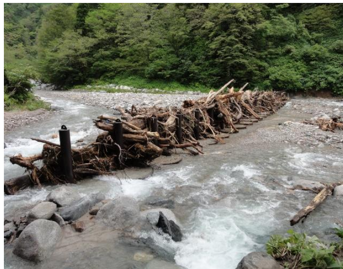
片貝川上流（東又谷）流木捕捉工 （魚津市 片貝国有林）

山地災害発生時には機動的に調査を行うとともに、大規模の場合は民有林支援を行い、被災地の早期の復旧・復興に向け、民有林・国有林が緊密に連携して災害対応を推進します。