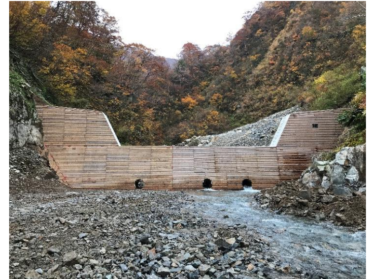
国産間伐材を使用した丸太残存型枠 (朝日町 小川国有林)