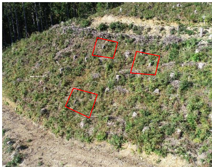
下刈省略を検証する試験地 (富山市 長棟国有林)

素材生産事業については効率的な作業システムを事業体と情報共有しながら生産性の向上に取り組みます。