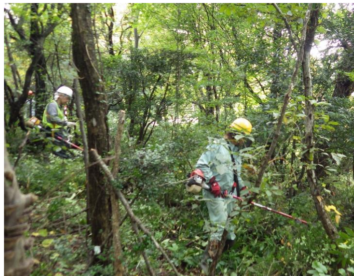
繁茂した灌木の状況（整備中）