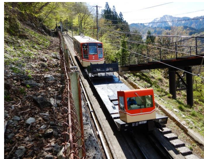
立山黒部アルペンルート (立山町 ブナ坂国有林)