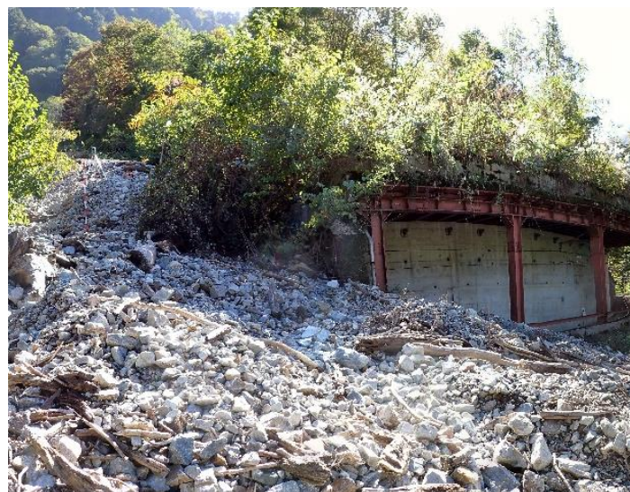
昨年9月豪雨により被災した黒部峡谷鉄道 （本年度復旧工事予定）