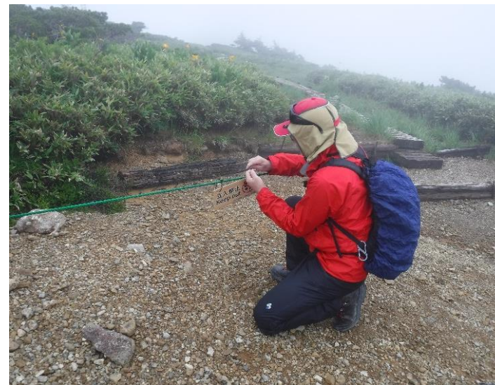
グリーンパトロールによる啓発看板設置 (富山市 黒部谷割国有林)