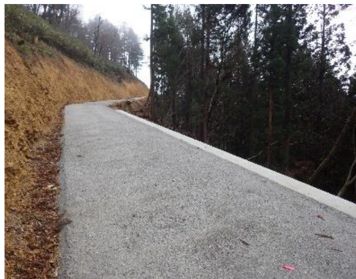
三本松割林道開設