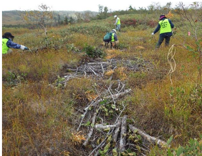
除伐木を利用した植生復元 (立山町 弥陀ヶ原 ブナ坂国有林)