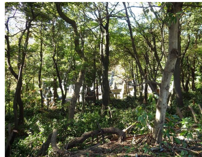
見通しがよくなった林内