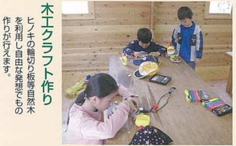
木エクラフト作り ヒノキの輪切り板等自然木 を利用し自由な発想でもの 作りが行えます。