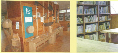
1階 森の展示室 2階 森の談話室