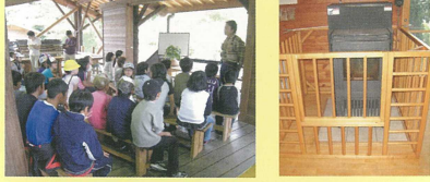
多目的東屋での森林教室