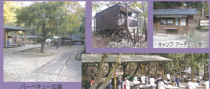
バーベキュー広場 トイレ・東屋