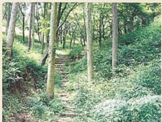
樹木見本林 約一ヘクタールに外国樹種を 含め七五種の樹木を植栽し ており、四季を通して観察な ど楽しむことができます。