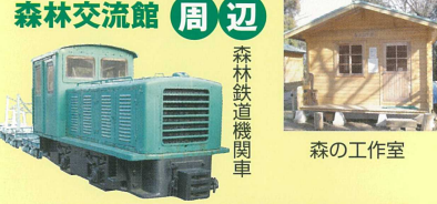
森林交流館 周辺 森林鉄道機関車 森の工作室