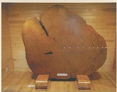
日本最大の木曽ヒノキ年輪盤 樹齢九五〇年の木曽ヒノキ (直径二〇センチメートル)