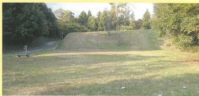
丸根山園地芝生広場