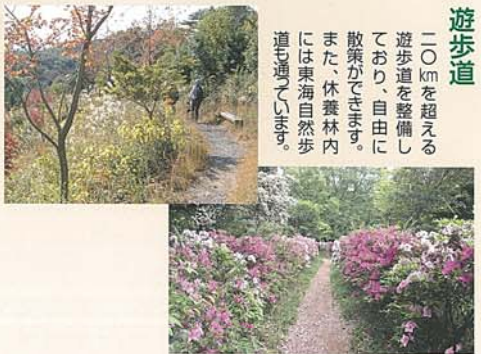
遊歩道 二〇kmを超える 遊歩道を整備し ており、自由に 散策ができます。 また、休養林内 には東海自然歩 道も通っています。