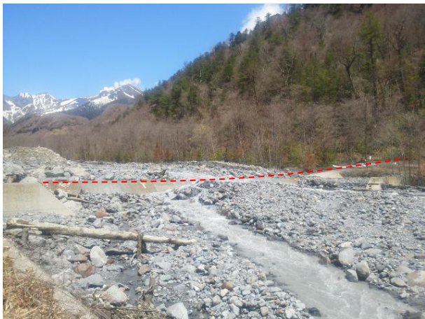
土石流センサー設置箇所(本日撮影)