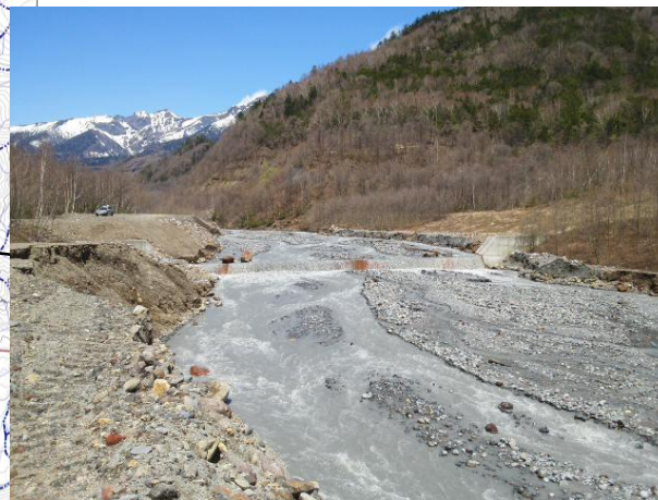
上記地点における本日の河道状況