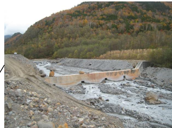
平成26年10月31日の河道状況