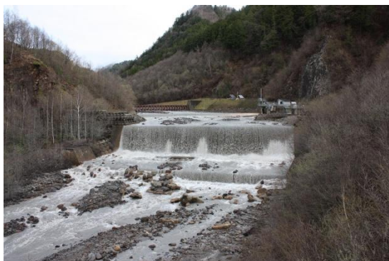
濁川橋(濁川と王滝川の合流地点)