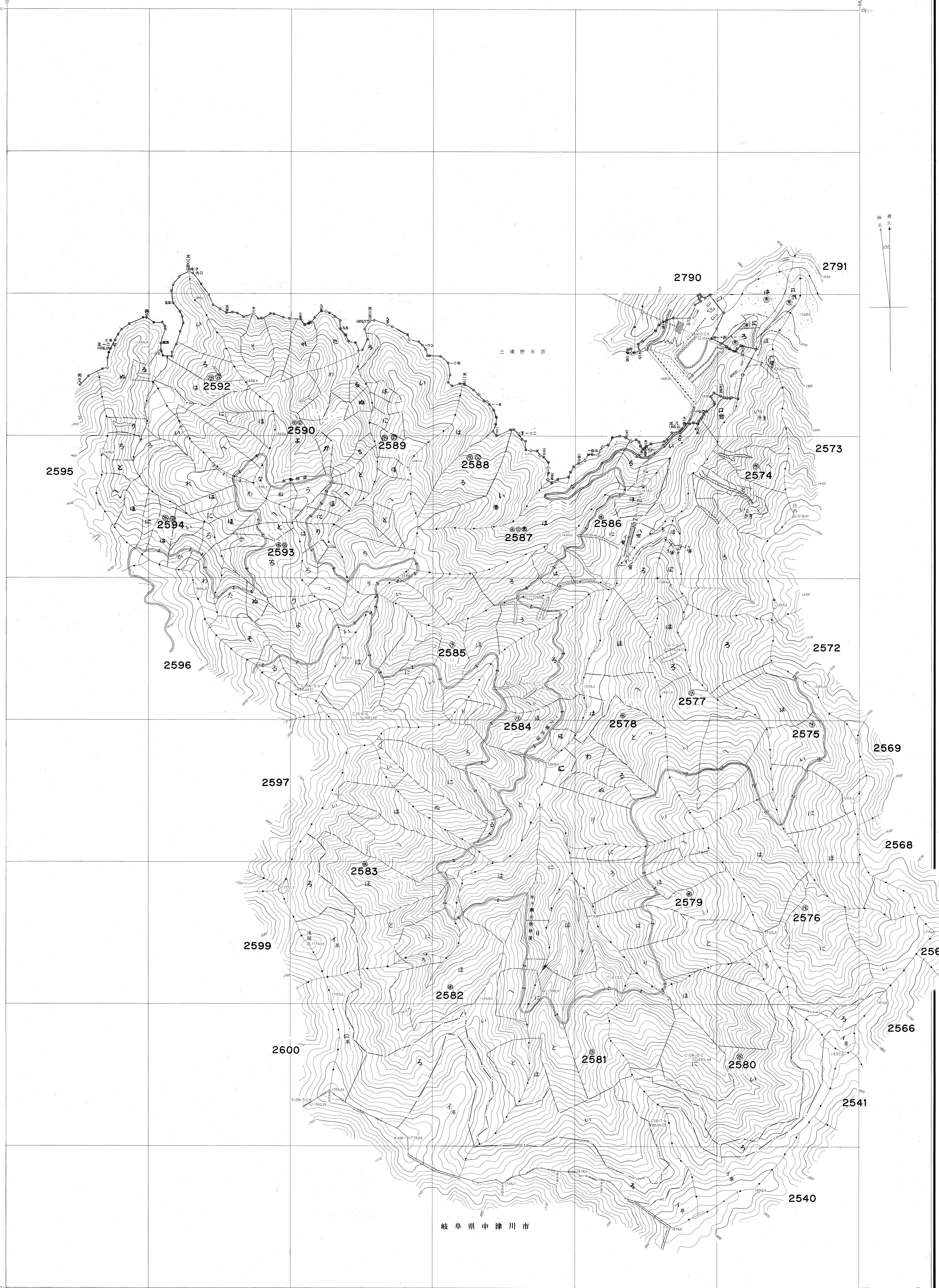
木曾森林管理署基本図