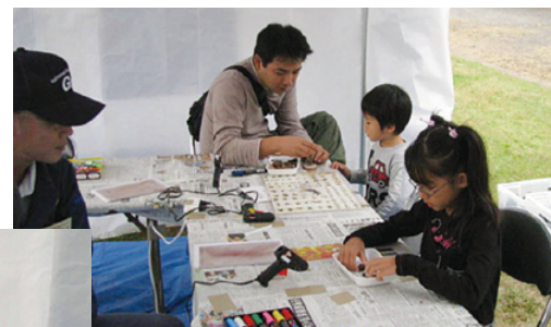
木とのふれあいの場を提供

両日ともに、あいにくの曇り空の下での開催となりましたが、多くの人が訪れ盛況でした。 木工クラフトでは、親子連れでの参加が多く、子ども達の想像力豊かな作品には親御さんも驚くばかりでした。中には子ども以上に夢中になる親御さんもいて終日賑わいをみせていました。