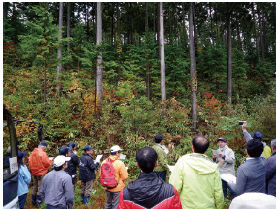
現地見学会の様子（飛騨川森林計画区）

今回いただいた地域の意見・要望は、これからの森林計画の策定作業に活かし、より良い計画となるよう、努めていきたいと考えています。