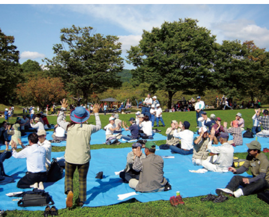
ミニゲームにより参加者の気持ちを一体に

十月一日（金）・二日（土）の二日間、中部森林管理局管内（長野、愛知、富山、岐阜各県）で活動している森林ボランティア団体・NPO等が一堂に会して、団体等のさらなる資質の向上と連携強化を図るとともに、広く一般市民の皆さんに、国民参加の森づくりへの理解や、森林環境教育の重要性をPRすることを目的とした、COP10パートナーシップ事業「森林ボランティア・NPO連携推進会議」が、松本市の後援により、長野県松本市のアルプス公園において開催され、管内の国有林、民有林等で活動している森林ボランティア団体やNPO等、十九団体（五十七名）と局署等の職員、合わせて総勢七十六名が参加しました。