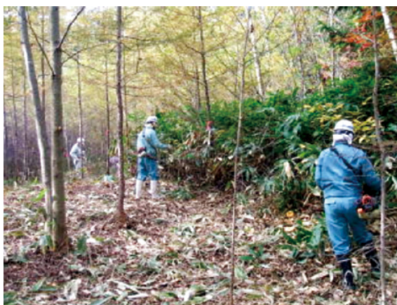
作業を行う長野林業土木協会中信支部の皆さん

今回のボランティア作業は、翌日実施される育樹祭の会場準備の一環として、会場の笹刈りや林道の草刈り等を実施していただきました。各種事業が最盛期を