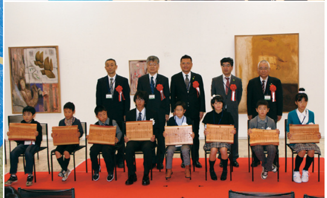
左：長野駅前ビルにて行った催しの一コマ 右：木工工作コンクール表彰式で中部森林管理局長賞を授与する森林整備部長（上）、記念撮影（下）