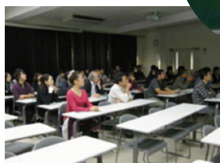
下平署長の講演の様子

研究教育と技術開発の相互協力を目的に、平成二十一年七月に締結した「連携・協力に関する協定」の一環として実施したものであり、当日は約五十名の学生が聴講しました。