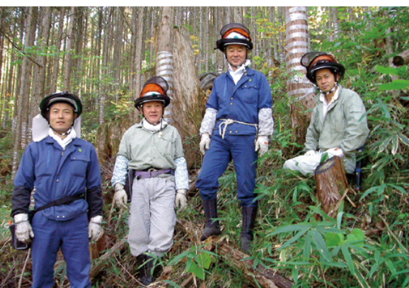
人の和をモットーに作業に当たる 北小川班の皆さん

ひのき一本一本に対する気遣いが災害に強く保水力の高い山を作り、相手への思いやりが明るい職場を作り、その延長線上に災害のない職場が築かれることをイメージしながら森林整備を行っています。これからも「人の和」を大切に、将来の山作りと心身の健康作りに全員で取り組んでいきたいと考えています。