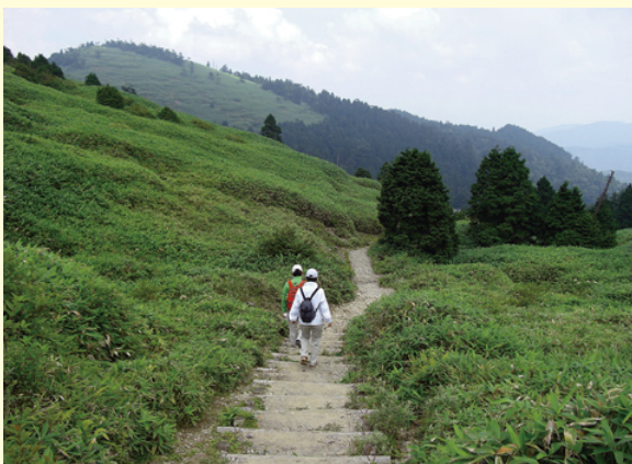
富士見台へと続く登山道

中山道が発展するようになり、東山道は歴史の陰に埋もれていましたが、現在は恵那山や富士見台への登山道として利用されており、当時の面影そのままに登山者の歩く姿が見られます。