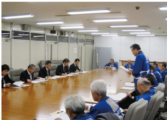
名古屋事務所副所長(岐阜県庁にて) 要望活動を行う

「名古屋事務所」木づかい推進月間中の十月十八日(月)に、岐阜県木材利用推進協議会(後藤直剛会長)と名古屋事務所が連携し、木材利用の推進に関する要望