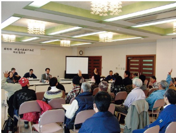
懇談会の様子（神通川森林計画区）