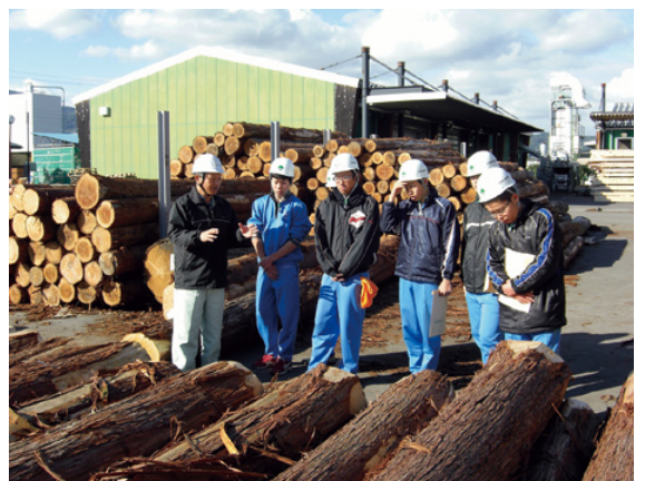
木材の流通加工について学ぶ

現地では、チェーンソーによる伐倒作業やスウィングヤーダーによる集材作業、さらに伐倒された木がプロセッサにより丸太にされ、フォワーダにより土場まで搬出されるのを目の当たりにするとともに、実際にノコギリを使って木を伐倒する体験に汗を流しました。