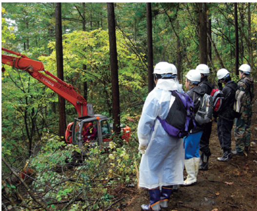
林業機械に見入る中学生

体験初日は、職員から二時間程度日本の森林・林業及び森林管理署の仕事について総体的な説明を受けた後、高社山国有林の高性能林業機械を使用したスギ、カラマツ素材生産事業箇所等を視察しました。