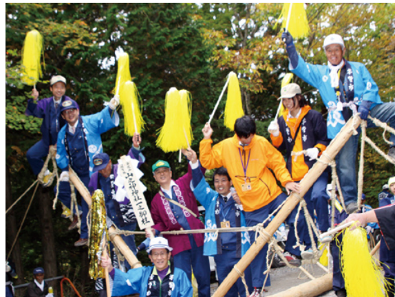
地元の皆さんと御柱の曳行

【南信署】十月十七日(日)、金沢山国有林において、金沢財産区の山神祭が開催されました。また、本年は七年に一度