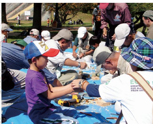
竹とんぼづくりに夢中

一方、体験している子ども達も満面の笑みを浮かべ、笑い声が飛び交い、親子・家族の皆さんも、揃って終始和やかに、そして真剣に取り組んでいる姿が見受け