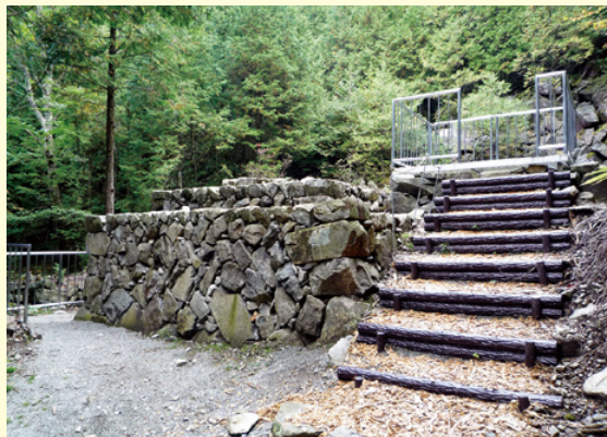
湯舟沢国国有林にある風穴 (かつては蚕種の保冷にも使われていた)