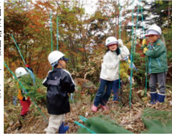
食害防止ネットの支柱を立てる小学生