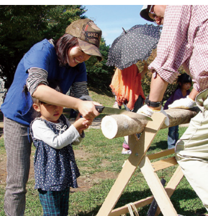
親子で丸太切り体験