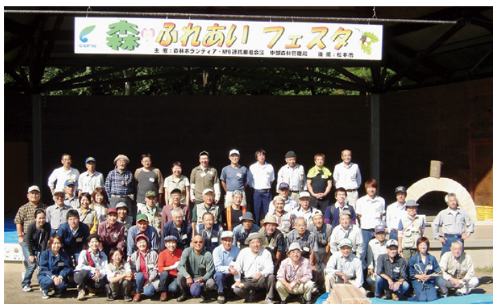
参加者（団体）の皆さん