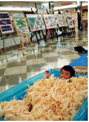
カンナ屑プールで楽しむ子供

昨年引き続き二回目となる本展示は、十月十六日(土)から十月三十一日(日)までの間、長野駅前ビルの「MIDORI」五階特設会場において、森林の働きや役割、地域材利用や国有林の取組についてパンフレットやパネル、木工品などを展示しPRしました。また、三十日(土)と三十一日(日)には、カンナ屑プール・ウッドイフ笑いやマイ箸作りなどを通じて木に直接触れて、木の香やぬくもりを体感してもらい、森林の大切さ・地域材の利用などについて普及啓発活動を行いました。