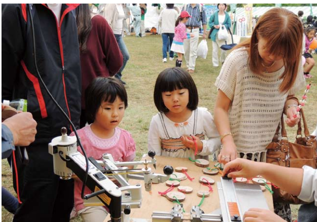
岐阜署のブース (ネームプレート制作)

このイベントには、岐阜県内外で活動する企業・団体が集まり、高性能林業機械の展示実演を初め、木製品やキノコなどの林産物の販売、体験型など趣向を凝らしたブースが数多く並び、二日目が雨天にもかかわらず県内外から約五万六千人が来場されました。