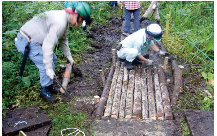
第 9 回：遊歩道整備（北信署）

十三回名古屋シティ・フォレスト事業を愛知森林管理事務所管内の瀬戸国有林において実施しました。