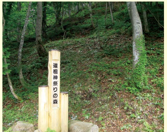
道祖神祭りの森 (つる切・除伐実施後)

湖畔が抜群のロケーションで人気です。また、野沢温泉村では、毎年一月十五日に全国的に有名な祭事「野沢温泉村道祖神祭り」があります。 野沢温泉村道祖神祭りは、五穀豊穡、家内安全、無病息災、良縁安産を願う野沢温泉村の伝統行事で、三〇〇年以上の歴史があります。ブナの大木で造る豪壮な社殿や、その社殿にたいまつで火を点けようとする村民とそれを守ろうとする厄年の男たちの激しい攻防戦が見物で、日本を代表する道祖神行事の一つとして、国の重要無形民俗文化財に指定されています。 火点けの攻防戦は激しく、火の粉が飛び散り、怒号も飛び交い、見ていて怖いぐらいです。また、高さ二〇mを超すブナの御神木で造られた社殿に火が入り崩れ落ちる様子も見どころです。 平成十五年には、祭事の総元締めである