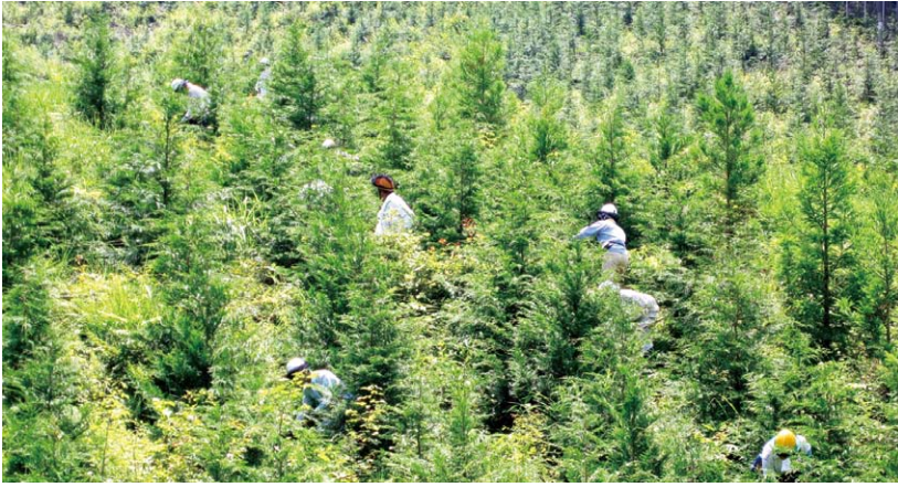
第 7 回：下刈作業（東濃署）