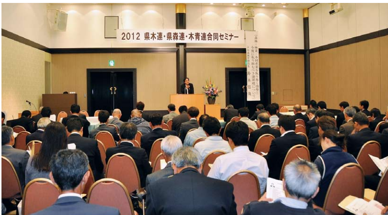
聴講する林業関係者

講演内容は、戦後日本の木材需給を振り返ることから始まり、木材使用の現状、合板、集成材、床板を巡る動きや公共建築物等における木材利用の具体例を紹介しながら、我が国の木材需給の現状と今後の課題、それを踏まえた方策までを分かりやすく解説しました。 聴講者から、「大変参考になった。ぜひ今回の講演内容を多くの人に広めてほしい。」といった声があがったこともあり、急遽、長野県林業普及協会等林業関係団体が合同で編集・発行する月刊誌「長野の林業」に講演要旨を掲載してはとの要請に応えるなど、大反響を巻き起こした講演となりました。