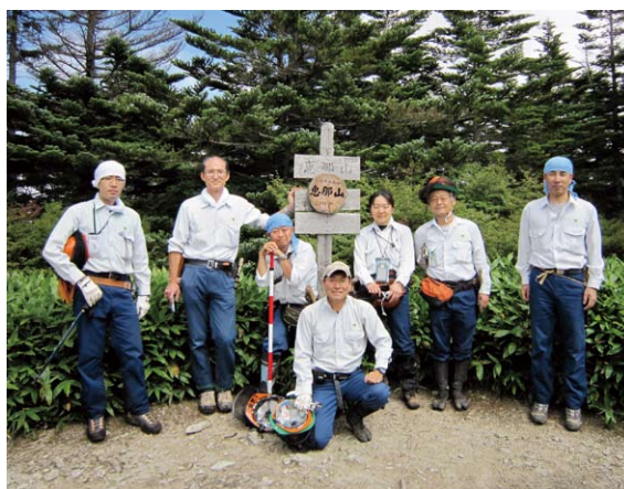
恵那山山頂にて（左から3人目が三浦森林官）