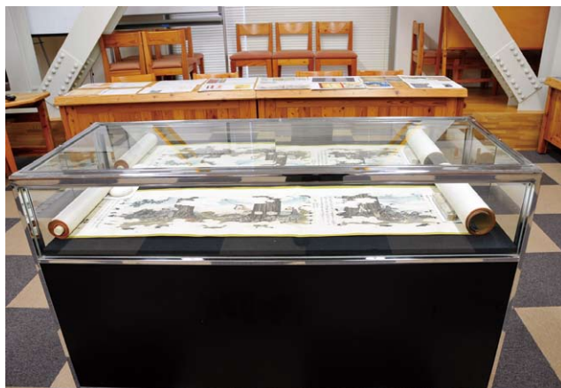
「木曽式伐木運材図会」はガラスケースに入れて展示

木曽林業の歴史について「木曽式伐木運材図会」を展示 「企画調整室・総務課」十月二十三日（火）からの一週間、開かれた国有林の活動の一環として、当局が所蔵する「木曽式伐木運材図会」をマスコミに公開しました。 「木曽式伐木運材図会」は中部森林管理局が所蔵する江戸時代後期頃の伐木運材の様子が描かれた絵巻物で、木曽地方林業の歴史を語る上で貴重な資料となっています。 図会は上下二巻となっており、一八四〇年代頃の、木曽地域の奥深い山から木材を伐り出し運び出す様子などが克明に画かれています。