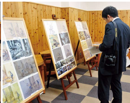
関連資料も展示し説明

木曽林業の歴史について「木曽式伐木運材図会」を展示 「企画調整室・総務課」十月二十三日（火）からの一週間、開かれた国有林の活動の一環として、当局が所蔵する「木曽式伐木運材図会」をマスコミに公開しました。 「木曽式伐木運材図会」は中部森林管理局が所蔵する江戸時代後期頃の伐木運材の様子が描かれた絵巻物で、木曽地方林業の歴史を語る上で貴重な資料となっています。 図会は上下二巻となっており、一八四〇年代頃の、木曽地域の奥深い山から木材を伐り出し運び出す様子などが克明に画かれています。