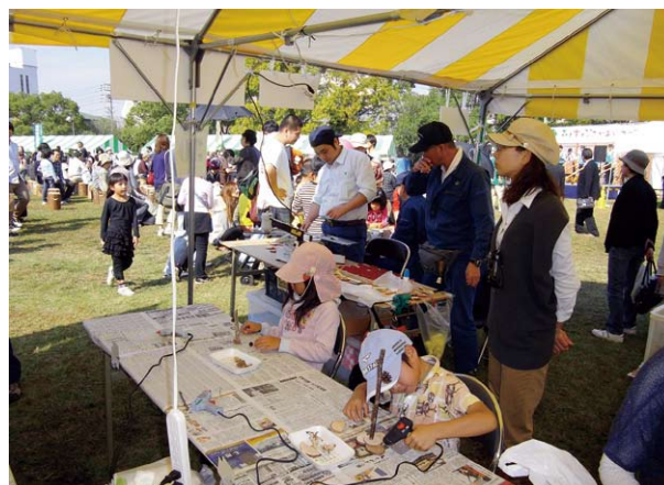
木工クラフト体験コーナーも大人気

岐阜森林管理署のブースでは、木製ネームプレート制作と木工クラフト体験を行い、両日とも長蛇の行列ができ、スタッフは昼食時間がとれないほどの賑わいを見せました。