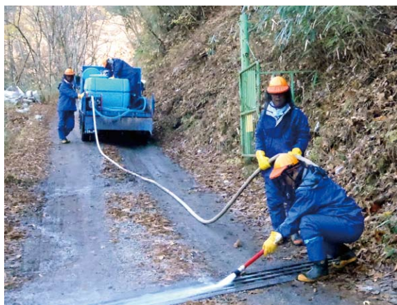
林道の横断溝をポンプで清掃

子供を対象に行った木工クラフト体験は、木の輪切り、小枝、松ボックリやドングリなど森から集めた幾種類もの材料を使用し思い思いの作品を制作するもので、子供たちの想像力豊かな作品を作り上げる姿と完成した作品の出来映えに親御さん方は大変満足されていました。