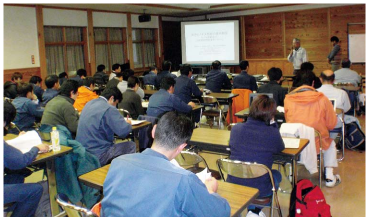
木曽署での研究発表の様子

今回の検討会には、昭和五十八年の試験地設定当初から地元上松町の町議会等の関心が高い、上松町議会の議員の皆さんと町の関係者にも参加していただきました。