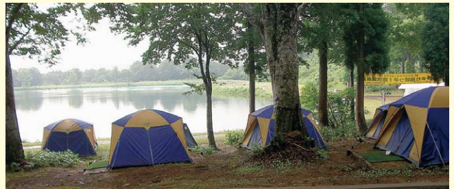
スタカ湖キャンプ場

グリーンシーズンには、豊かな自然と親しめる場として利用されており、郷土の森に指定されているブナ林の芽吹きや黄葉、ユキツバキ、サンカヨウ、ヤナギランなどの花々などが高原を彩ります。 今シーズンは、十二月一日から天然雪一〇〇%でオープンしており、雪の状況にもよりますが、毎年ゴールデンウィークまで滑走可能です。また、今年には野沢温泉にスキーが伝来して一〇一年目になります。新たな一〇〇年へ向けてスタートしています。