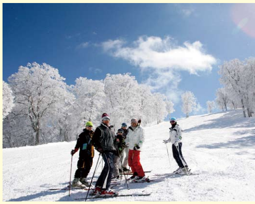
バリエーションに富んだゲレンデを有する 野沢温泉スキー場

「北信署」野沢温泉村は、長野県の北部に位置し、広大なスキー場と豊富な湯量を誇る温泉は、長野県を代表する観光地のひとつです。 野沢温泉村に關係する国有林は巢鷹山・二ツ橋・北ノ入・水尾山・毛無・芋畑・池の沢国有林の七国有林、一、四九二鈔あります。 特に野沢温泉スキー場は、毛無山山頂か