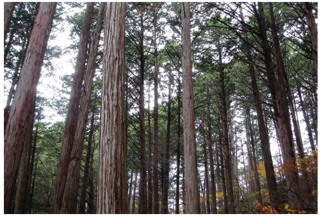
林木遺伝資源保存林 (奥千本)