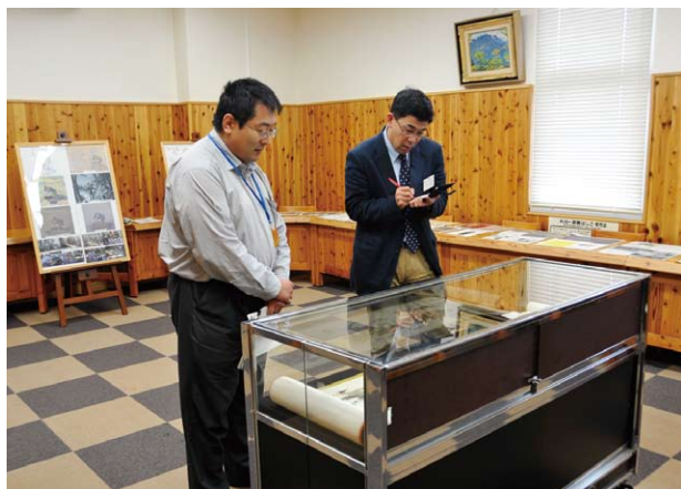
図会の説明に当たる職員

講演内容は、戦後日本の木材需給を振り返ることから始まり、木材使用の現状、合板、集成材、床板を巡る動きや公共建築物等における木材利用の具体例を紹介しながら、我が国の木材需給の現状と今後の課題、それを踏まえた方策までを分かりやすく解説しました。 聴講者から、「大変参考になった。ぜひ今回の講演内容を多くの人に広めてほしい。」といった声があがったこともあり、急遽、長野県林業普及協会等林業関係団体が合同で編集・発行する月刊誌「長野の林業」に講演要旨を掲載してはとの要請に応えるなど、大反響を巻き起こした講演となりました。