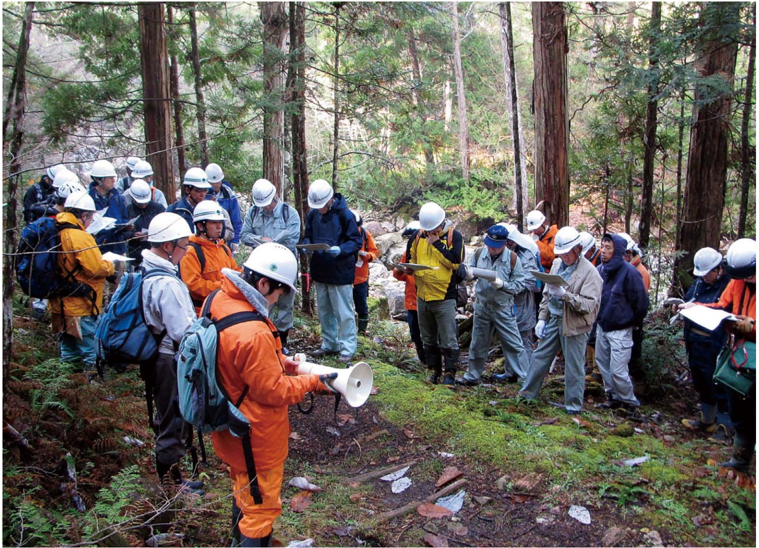
赤沢（小川入国有林）で開催された現地検討会