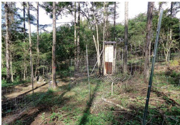
完成した囲いワナの追い込み・搬出スペース

このため、比較的頻繁に見回る必要がなく、また、鹿肉が美味しく食べることができるよう肉の品質を保つことが可能な捕獲方法として囲いワナを試験的に設置し、捕獲から食肉利用までを視野に効率的な方策を検討することとしました。 設置する囲いワナについては、安価で、なるべく警戒心を持たないような構造とし、青草が無くなる時期以降、