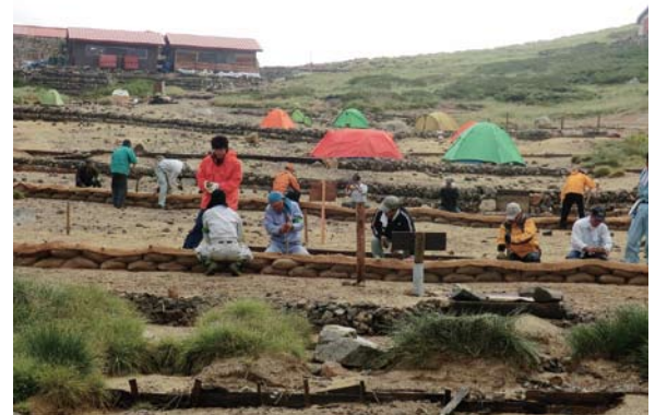
土嚢を設置し杭でとめる作業

（旧神岡事務所管内の森林官及び事業所主任）、環境省平湯自然保護官事務所、双六小屋の三者で協議して計画を進めるとともに、森林パトロールボランティア五団体、（社）名古屋林業土木協会、名古屋造林素材生産事業協会、山小屋関係者らに保全活動へのボランティア参加を呼び掛けました。