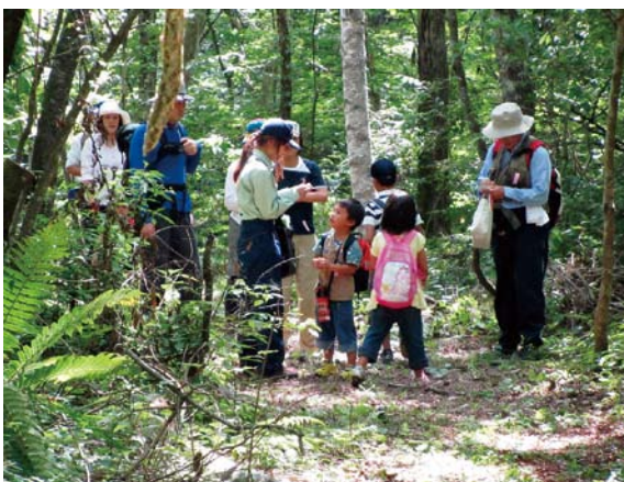
職員の案内により自然観察

くりワナの設置が、効果的な方法として実施されていますが、頻繁に見回りが必要なことや捕獲後の止め刺しや埋設などに課題があります。また、くりワナにかかったニホンジカは肉の品質低下を招くストレスホルモンが出る、食肉利用の普及を進める上ではデメリットにもなっています。