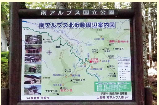
北沢峠の案内看板

日本最大の断層「中央構造線」が縦貫する分杭峠は、ゼロ磁場としても近年有名となり多くの観光客が訪れます。ゼロ