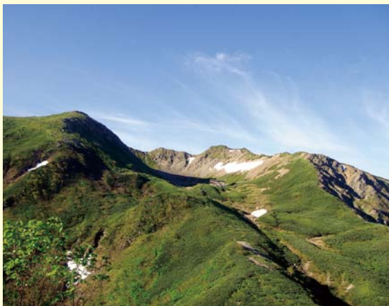
仙丈ヶ岳の藪沢カール

この地域の国有林野は南アルプスを主体に管理し森林生態系保護地域など各種保護林のみならず、地元の方々と共に後世に残す努力を行っています。