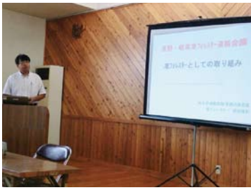
活動報告をする 岐阜県准フォレスター

フォレスターがお互い連携し、「森林づくり」や「道づくり」等に対しての課題の洗い出しや解決方法の検討などを目的に両県の県職員准フォレスターが参集して実施されるものです。