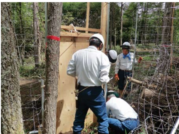
柵の設置作業を行う職員

この度、局プロジェクトチームでは、東信森林管理署の協力を得て、囲いワナ等を設置し捕獲実証試験を行うこととし、八月二十八日から三十日にかけて関係課職員により囲いワナの設置作業を行いました。