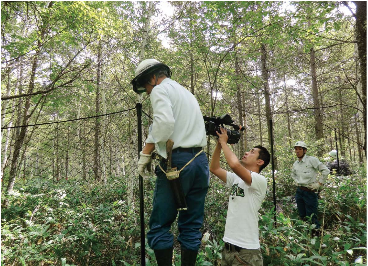
囲いワナの設置作業を行う職員