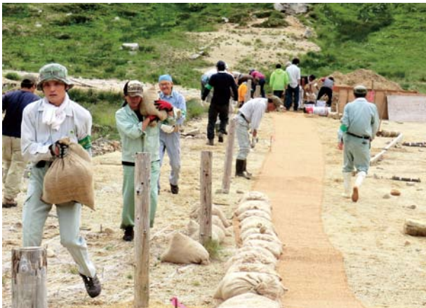
土嚢を運搬する作業者