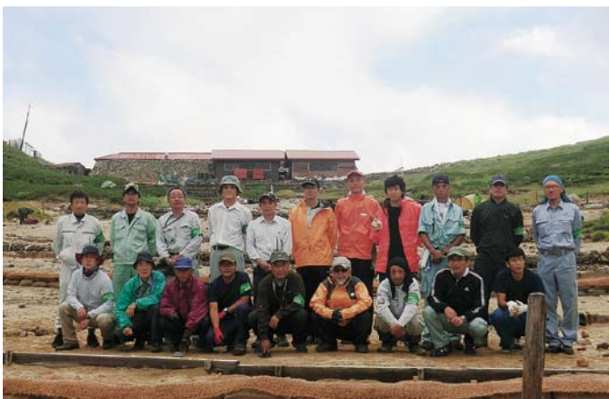
作業お疲れ様でした