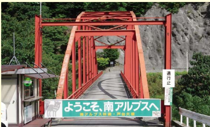
戸台大橋の料金所

の調整が難航し、完成までには十三年の年月を要しました。現在、長野県側は、市営バスが四月から十一月まで運行し、登山者や観光客を県境であり登山の出発点でもある北沢峠まで運行しております。乗車バス内では、運転手による地質・植物・動物等について説明がありますので、初めての方も楽しめるのではないのでしょうか。また、戸台大橋からは一般車の通行が規制されております。