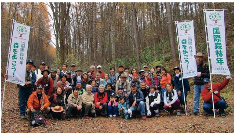
国際森林年記念行事として森林教室も実施