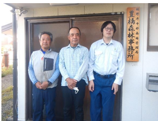
森林事務所職員(右端が筆者)

国有林は、所在する地域によって様々な特徴があり業務内容も多種多様です。林業は近年、新しい技術も導入され機械化、IT化も日々進化していますが、長い目で見て自然豊かな森林を未来につないでいくため、一緒に森づくりをしてみませんか。