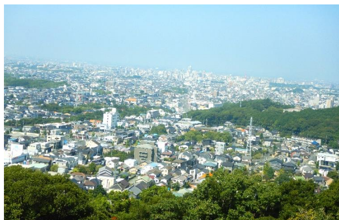
豊橋自然歩道から展望した豊橋市市街地

明な場所についての問い合わせが多くあります。不法投棄が多いため、その対策としてパトロール強化や看板の設置により注意喚起しています。また、全国で行われている530運動の発祥地である朝倉川530大会へ参加しゴミ拾いと回収を行っています。