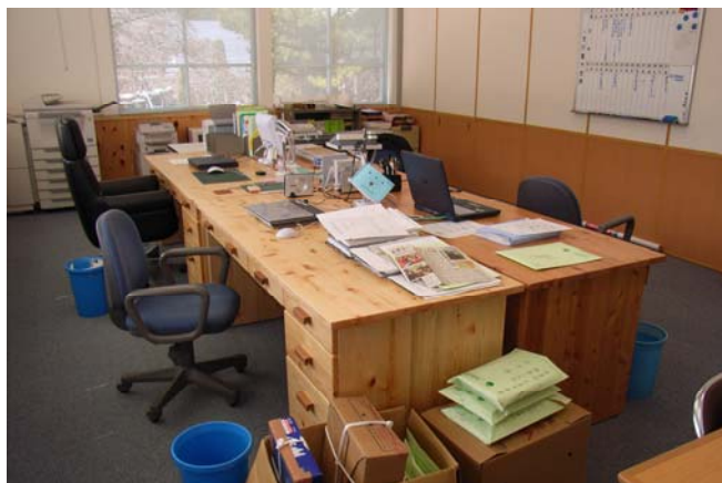
事務所内の様子(事務機は左がヒノキ製、右がカラマツ製)