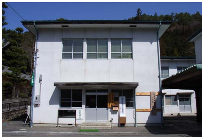
事務所の外観(当センターは2階を使用、1階は木曽福島森林事務所)