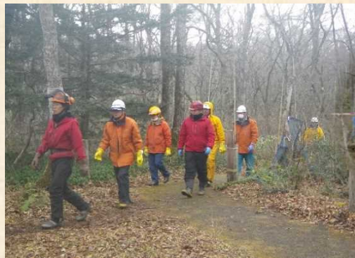
担当の現場に向かう参加者の皆さん