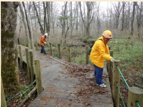
グリーンロープの撤去作業