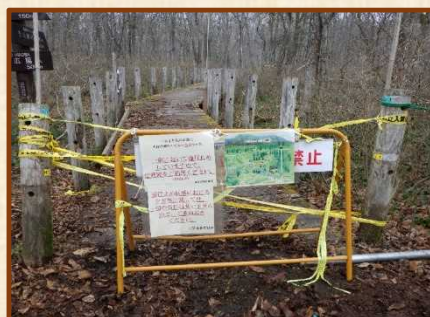
木道迂回路の案内掲示