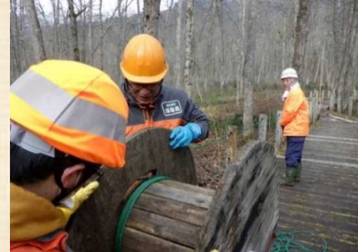
ドラムによる巻き取り作業