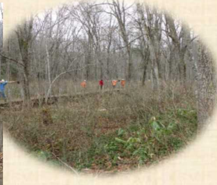
冬の到来を感じる園内の景色