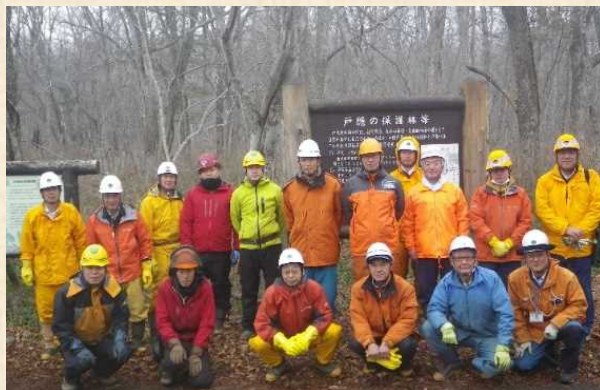
悪天候の中での作業、皆さんありがとうございました