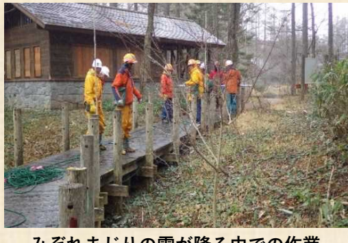
みぞれまじりの雪が降る中での作業