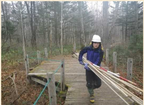
木道際の竿立て作業