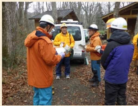
長屋主任森林整備官から作業説明