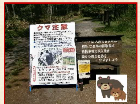
5月には園内に熊が出ました