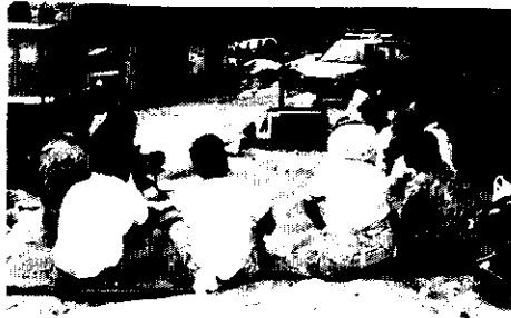
写一 1 ビデオを活用しての安全懇談会の状況

は、各作業者の作業行動、現場の作業施設、また監督職員と現場作業者との同時作業の実態等、できる限り克明に撮影し収録する。