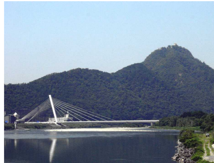
金華山と鶴飼い大橋