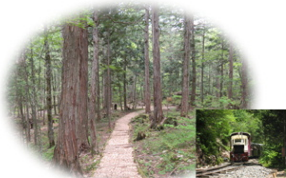
赤沢自然休養林 樹齢300年の木曽ひのきの森林と 清流、澄んだ空気が快い 森林浴発祥の地