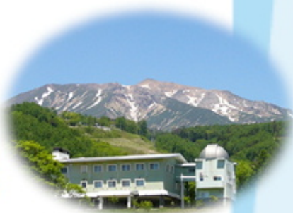
お泊まりは、おんたけ休暇村