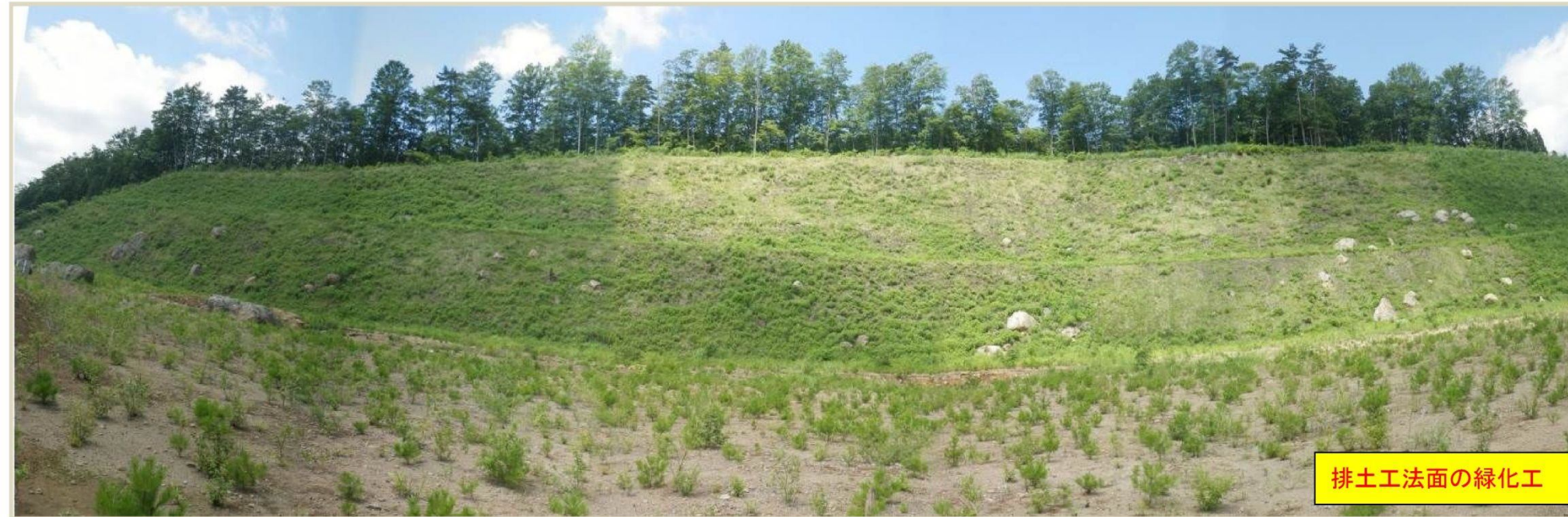
排土工法面の緑化工