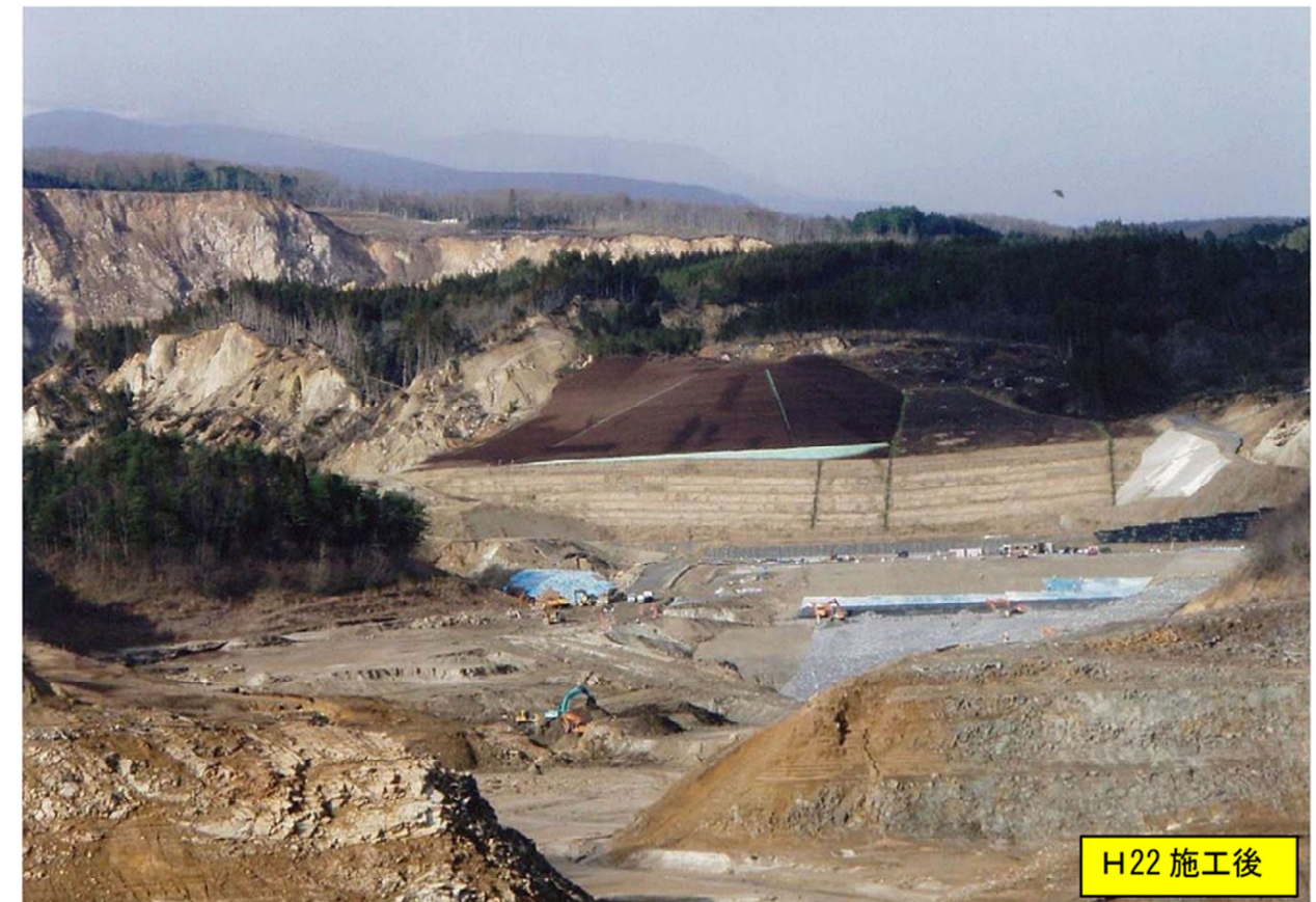
末端ブロック山腹緑化工