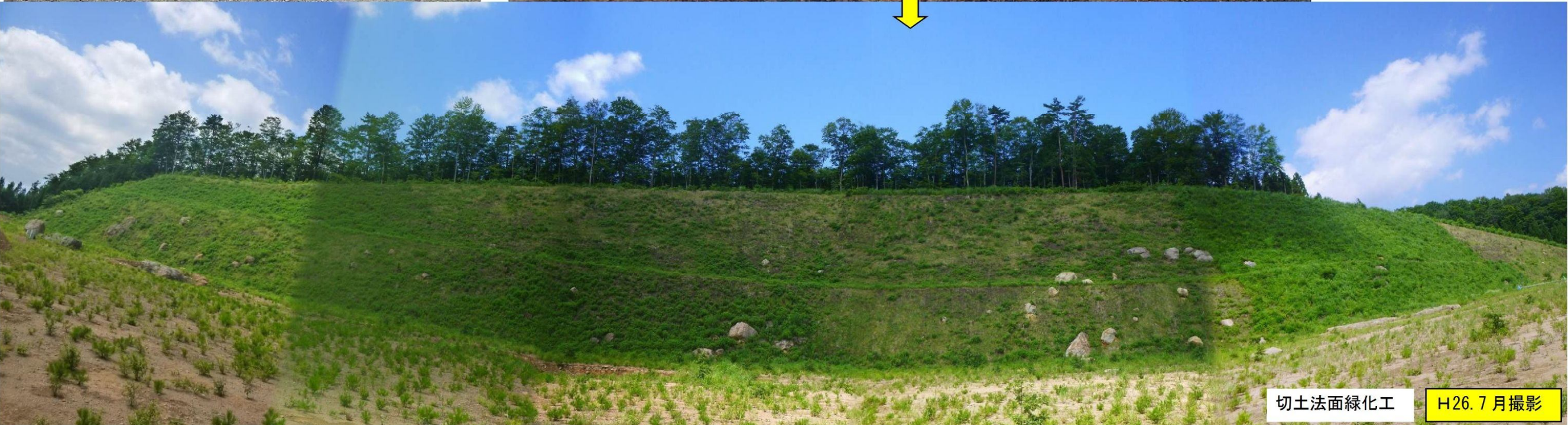
切土法面緑化工 H26. 7 月撮影