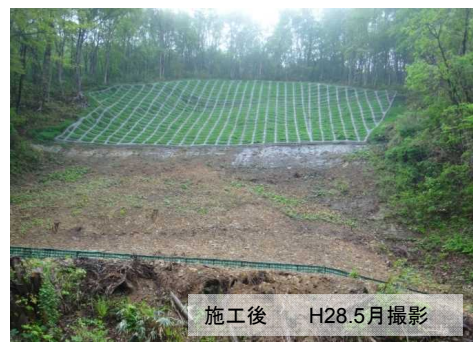
小股沢排水トンネル補修 [地すべり防止工事]