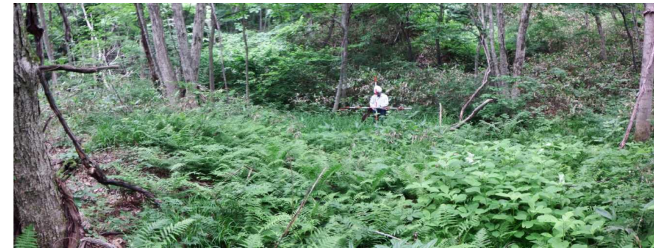
地すべりブロック内の湿地帯の状況（H27.8月撮影）