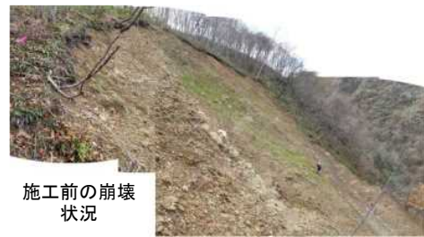
ニゴリ沢第一工区 [山腹工(簡易法砕吹付工)]

民有林直轄地すべり防止事業では平成27年度は山腹工を中心とした工事を施工しました。あわせて、排水トンネル工の補修工事についても引き続き進めているところです。