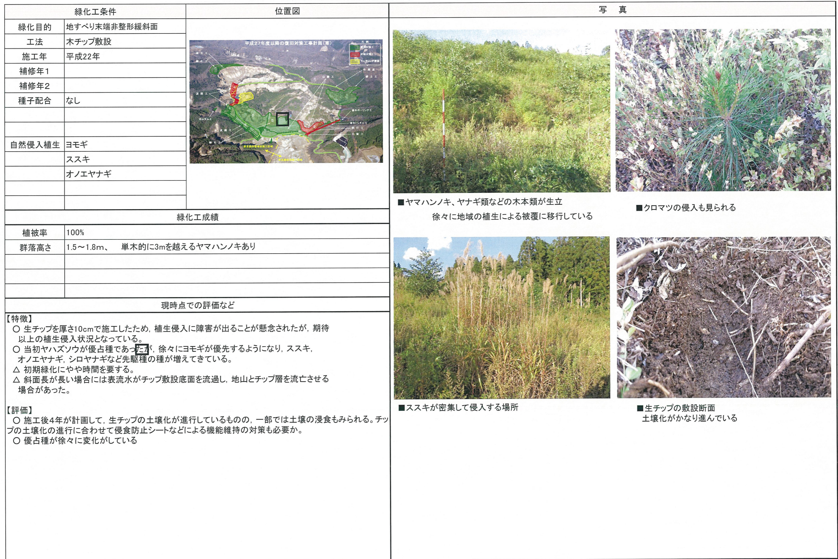
表 2. 4.16 緑化工の対策成果一覧表 (4/6)